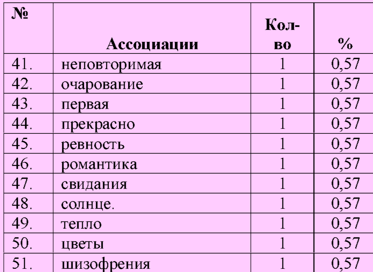
Таблица 1. Результаты ассоциативного эксперимента