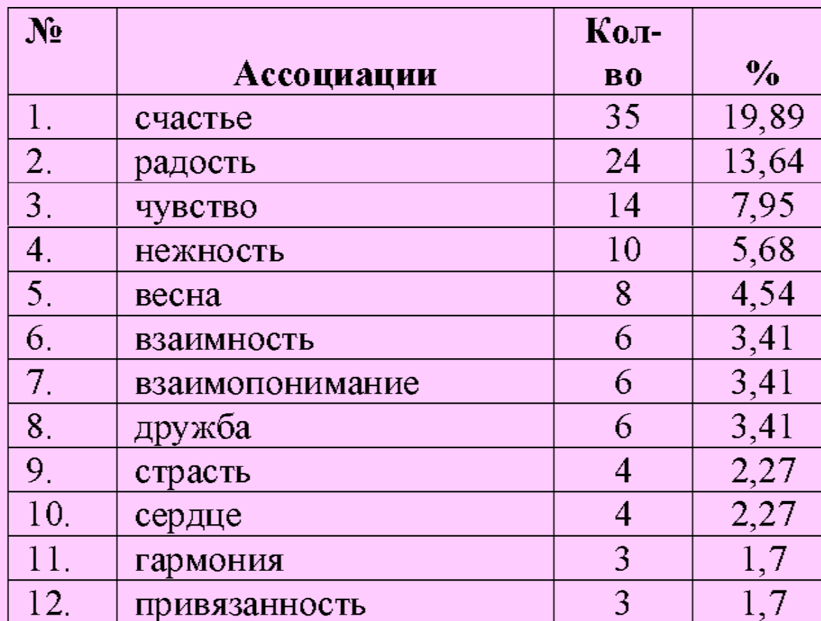
Таблица 1. Результаты ассоциативного эксперимента