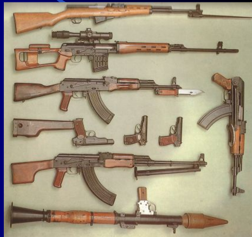
Советское стрелковое оружие