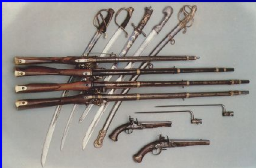
Холодное и огнестрельное оружие (XVIII-XIX века)

С 16 века Тула - кузница русского оружия. С тех самых пор тульские оружейники стали вооружать русскую армию пушками, ружьями.