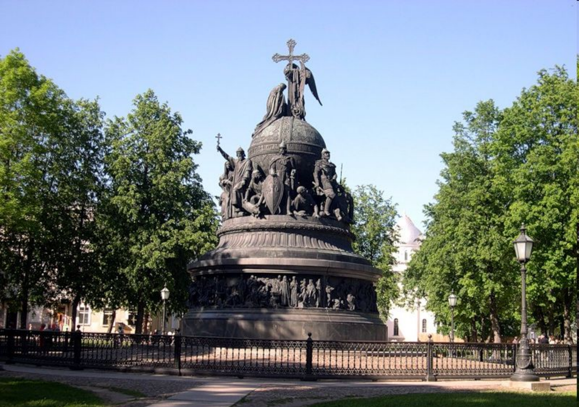
Памятник 1000-летию России. Великий Новгород. Установлен в 1862 г.