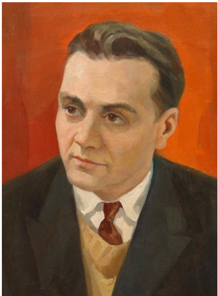
Василий Александрович Сухомлинский (1918-1970)

«Не будем бояться этих слов – святое и незыблемое ».