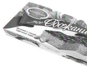
Ореховый в глазури Вес: 250 г