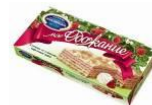
Клубника со сливками