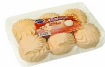
Крем-брюле Вес: 250 г