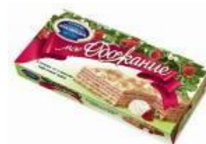
Клубника со сливками