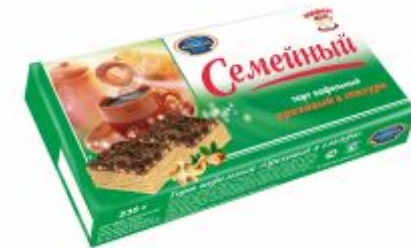
Ореховый в глазури