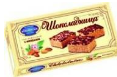
Шоколадница с миндалем