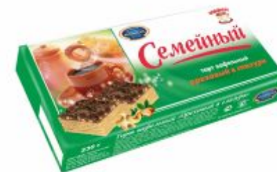
Ореховый в глазури