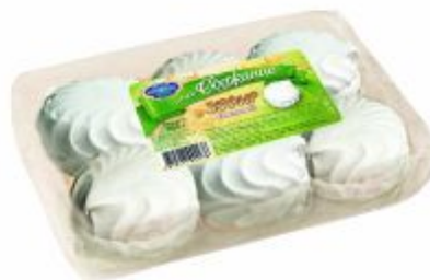
Ванильный Вес: 250 г