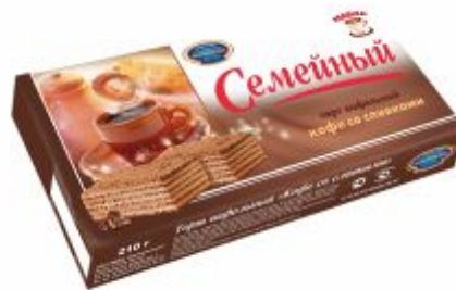
Кофе со сливками