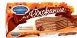
Кофе со сливками