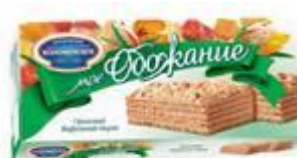
Ореховый Вес: 230 г