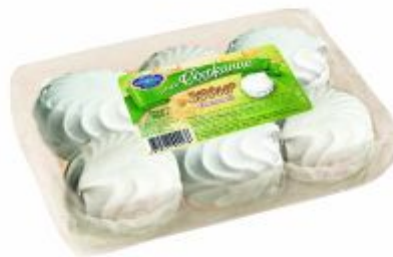
Ванильный Вес: 250 г