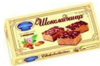
Шоколадница с миндалем