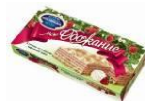
Клубника со сливками