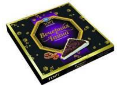
С грецким орехом