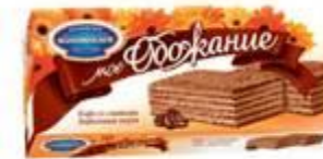
Кофе со сливками