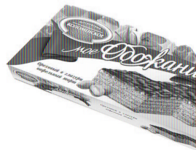
Ореховый в глазури Вес: 250 г