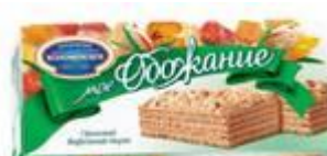
Ореховый Вес: 230 г