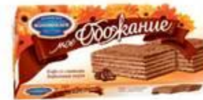
Кофе со сливками