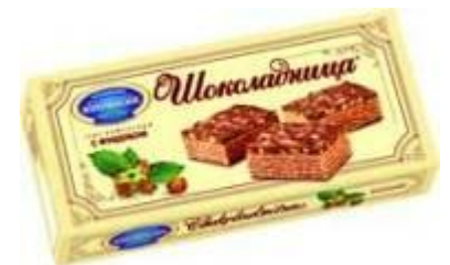
Шоколадница с фундуком