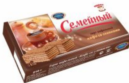
Кофе со сливками