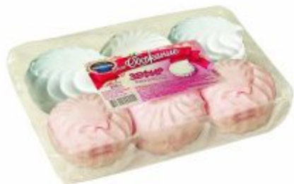
Бело-розовый Вес: 250 г