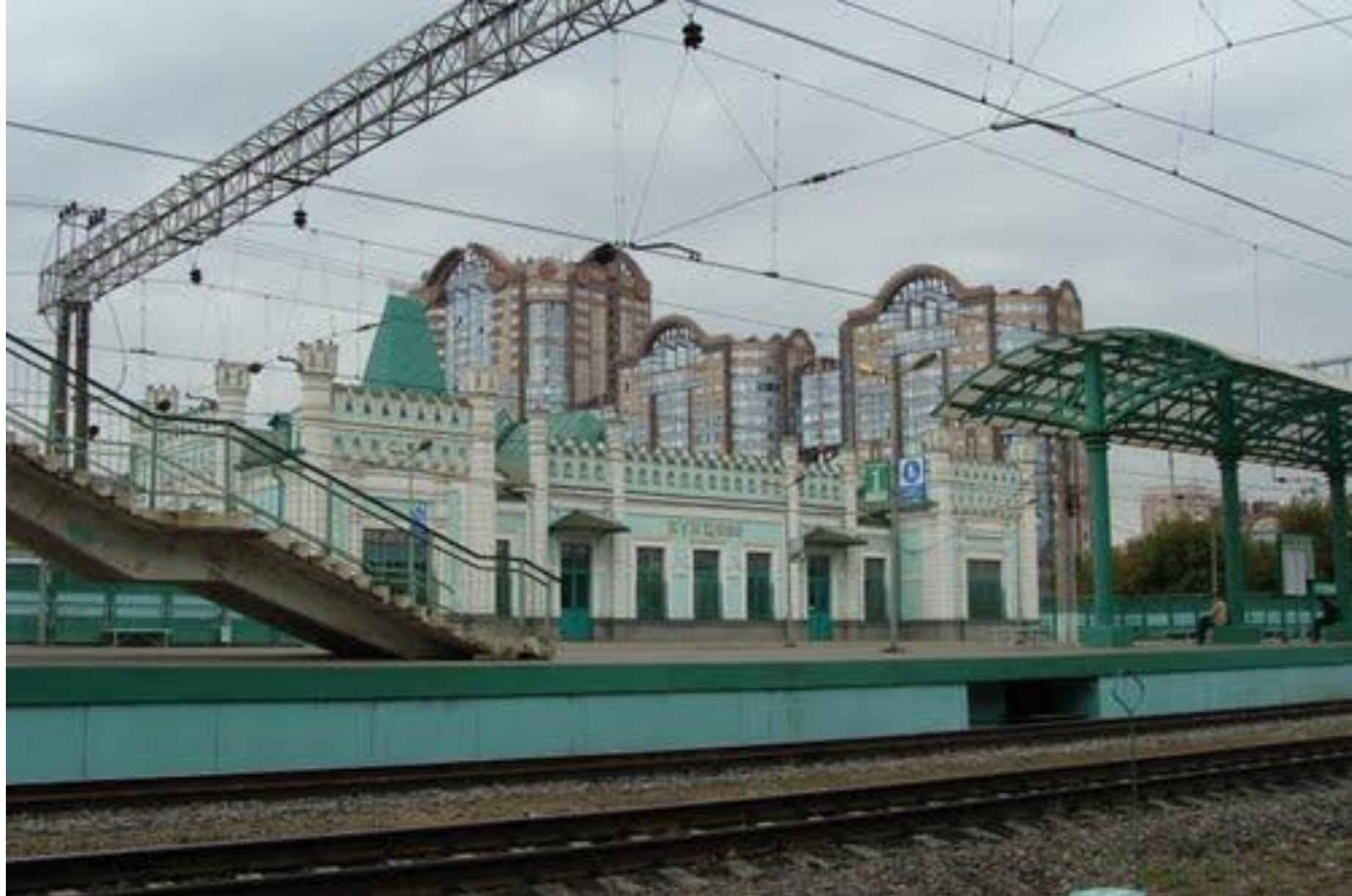
КУНЦЕВО (ближайшая ж/д станция)