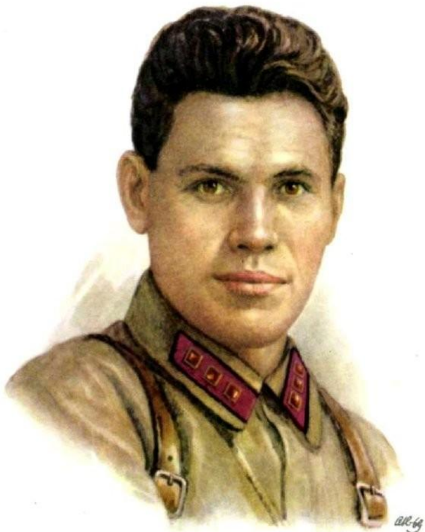
Герой Советского Союза ВАСИЛИЙ ГЕОРГИЕВИЧ КЛОЧКОВ