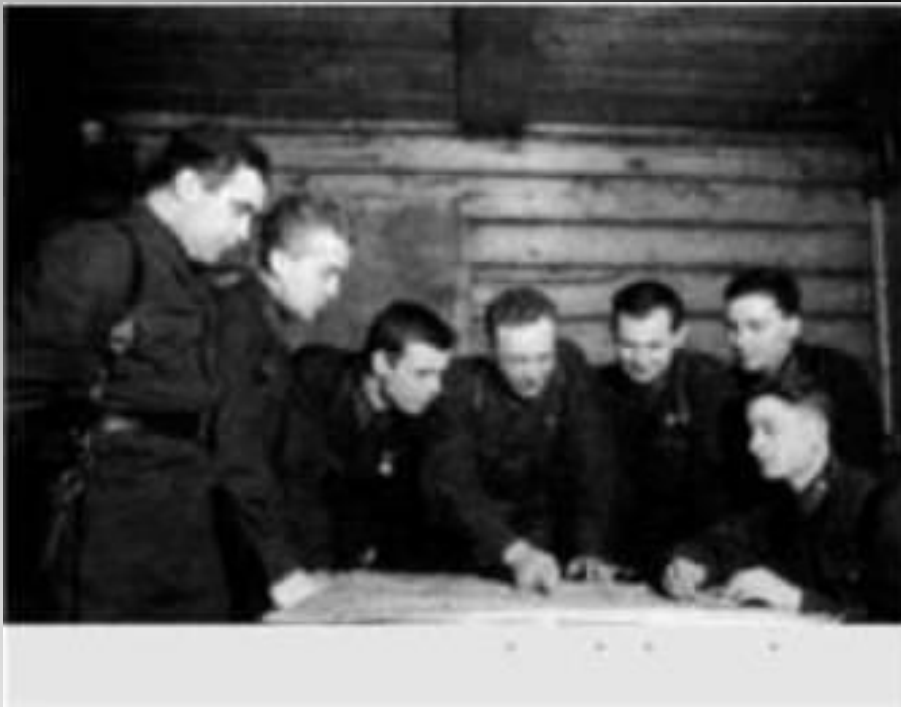
Командование 1075-го стрелкового полка 8-й гвардейской стрелковой дивизии.

Одновременно второй сильный удар в направлении Крюково противник нанес со стороны Матушкино на левом фланге 7-й гвардейской стрелковой дивизии (примерно в районе между деревней Матушкино и прудом Водокачка). Здесь бой начался также 1 декабря утром. Противник не рассчитывал здесь на упорное сопротивление наших частей, лишь несколько часов назад вышедших из окружения.