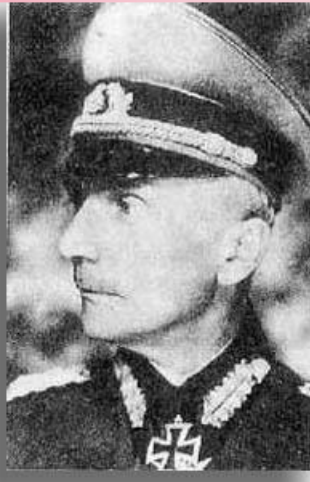
Генерал-фельдмаршал Федор фон Бок