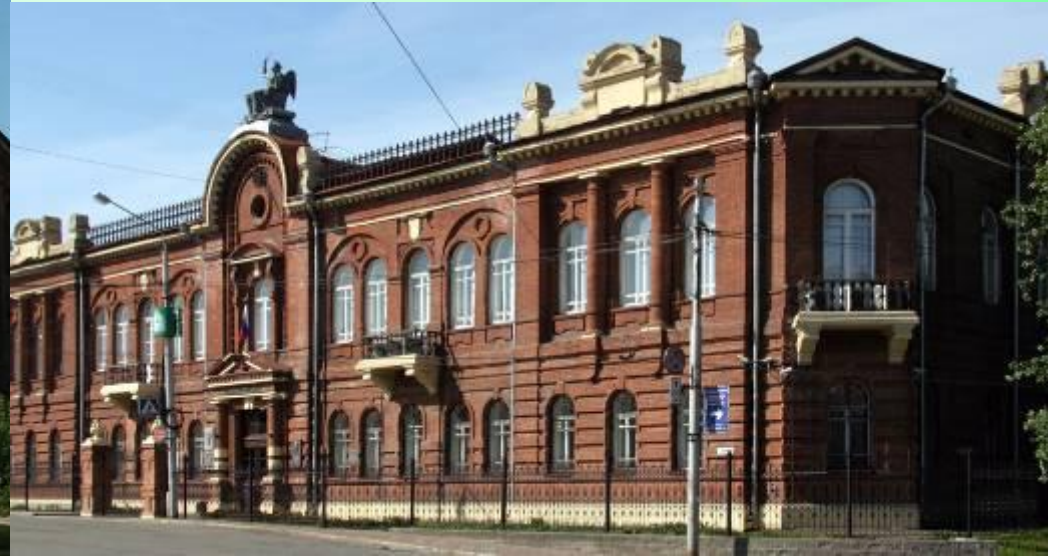
6. Здание Окружного суда. 1902-1904 гг.