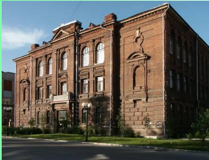
5. «Красный корпус» ТГАСУ. 1902-1904 гг.