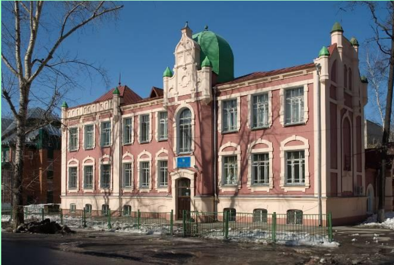
9. Пироговское городское училище . 1911-1912гг.

Здание ассиметрично. Наряду с использованием ренессансно-барочных элементов, вводились готические формы, декоративные детали модерна и неоклассицизма.