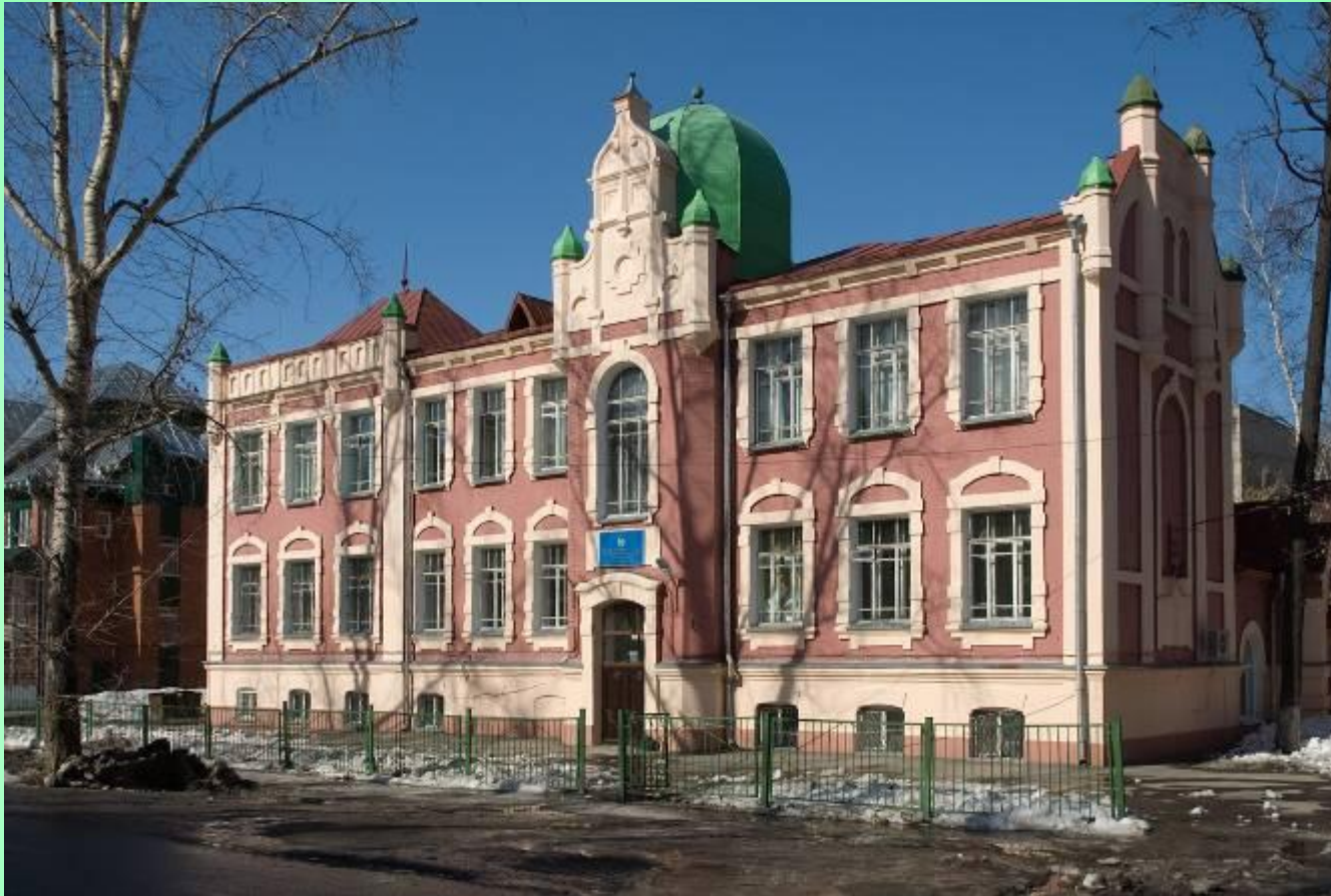
9. Пироговское городское училище . 1911-1912гг.

Здание ассиметрично. Наряду с использованием ренессансно-барочных элементов, вводились готические формы, декоративные детали модерна и неоклассицизма.