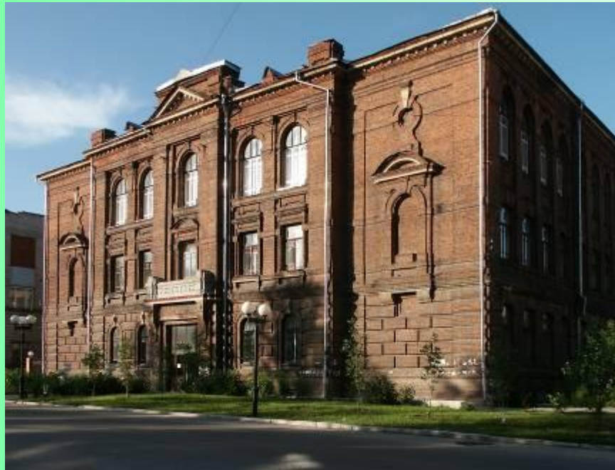
5. «Красный корпус» ТГАСУ. 1902-1904 гг.