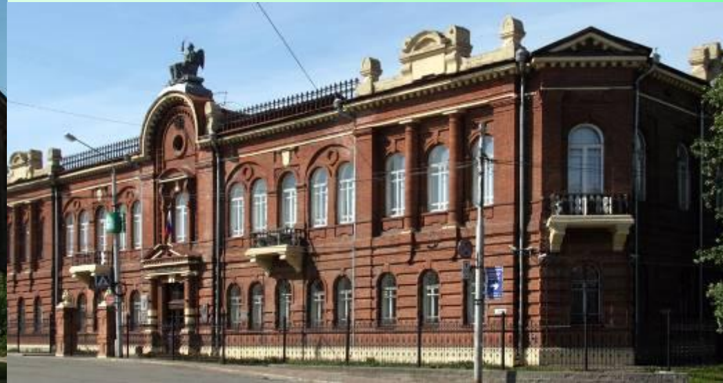
6. Здание Окружного суда. 1902-1904 гг.