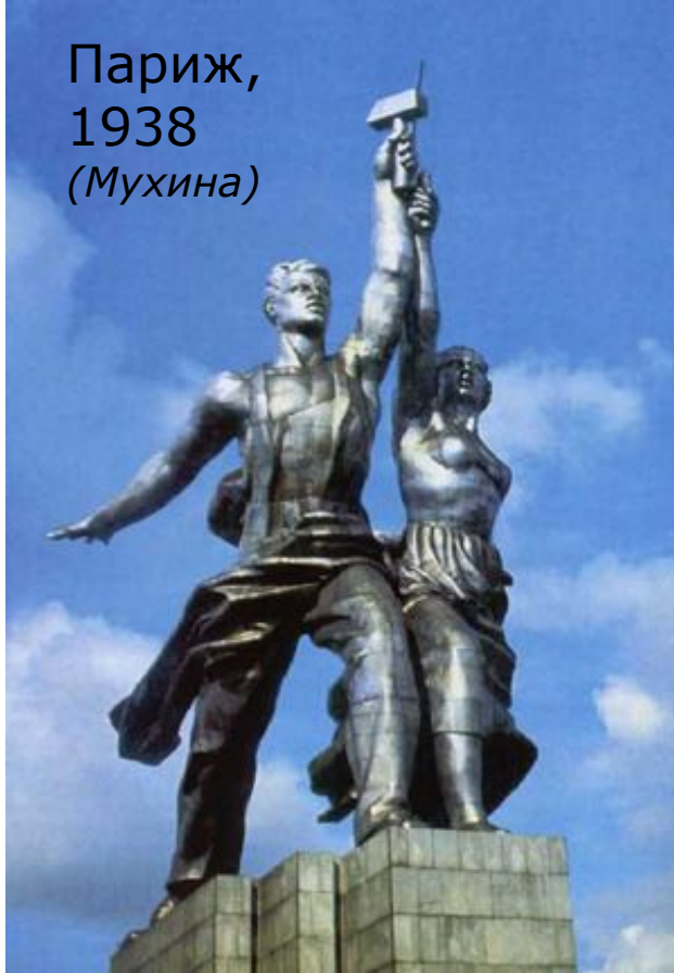
Париж, 1938 (Мухина)