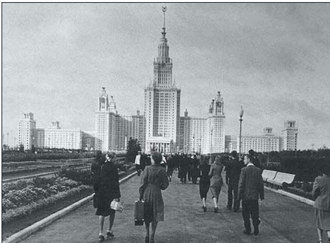
Сентябрь 1953 г.