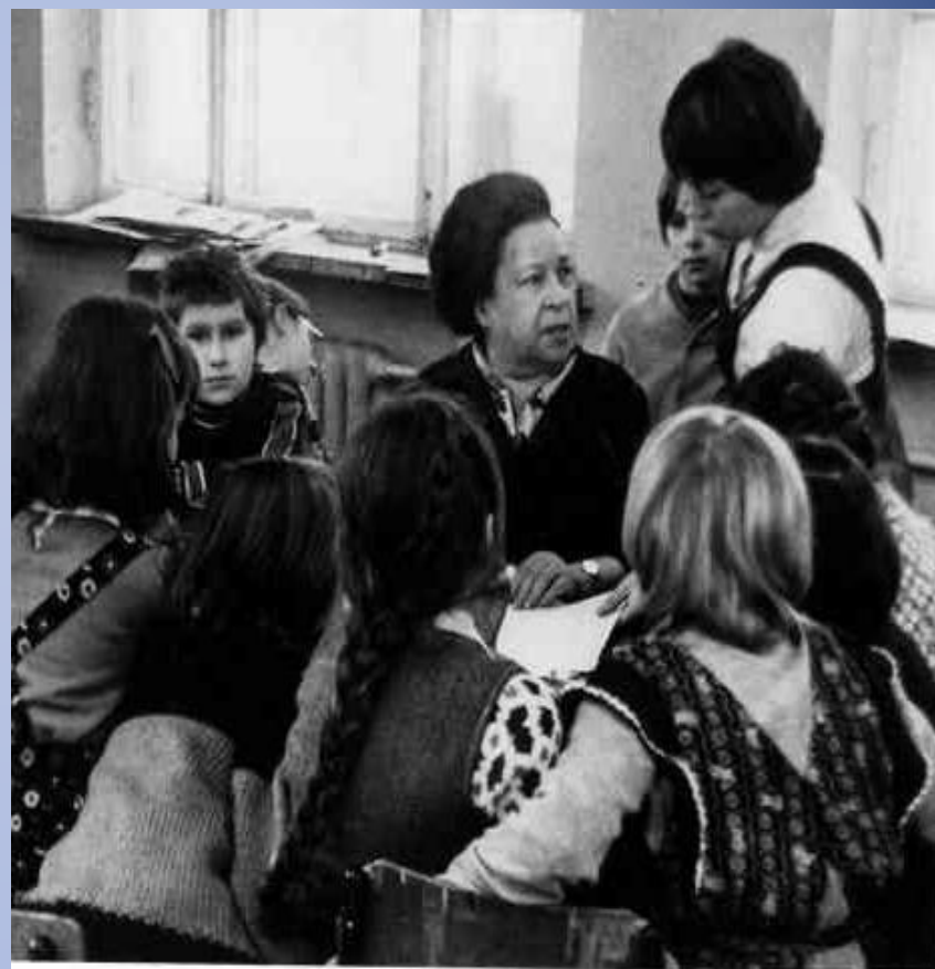
Агния Барто с учащимися школы. 1978 г.