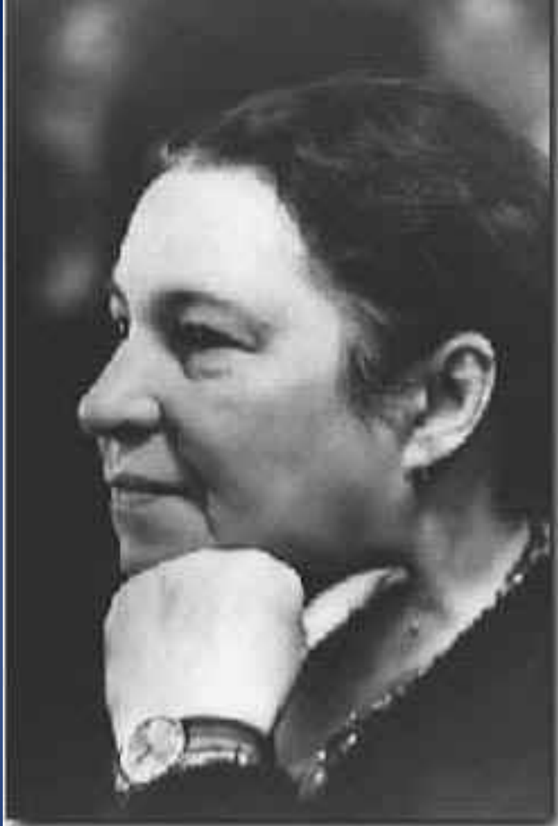
Агния Львовна Барто