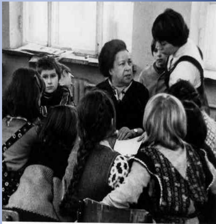
Агния Барто с учащимися школы. 1978 г.