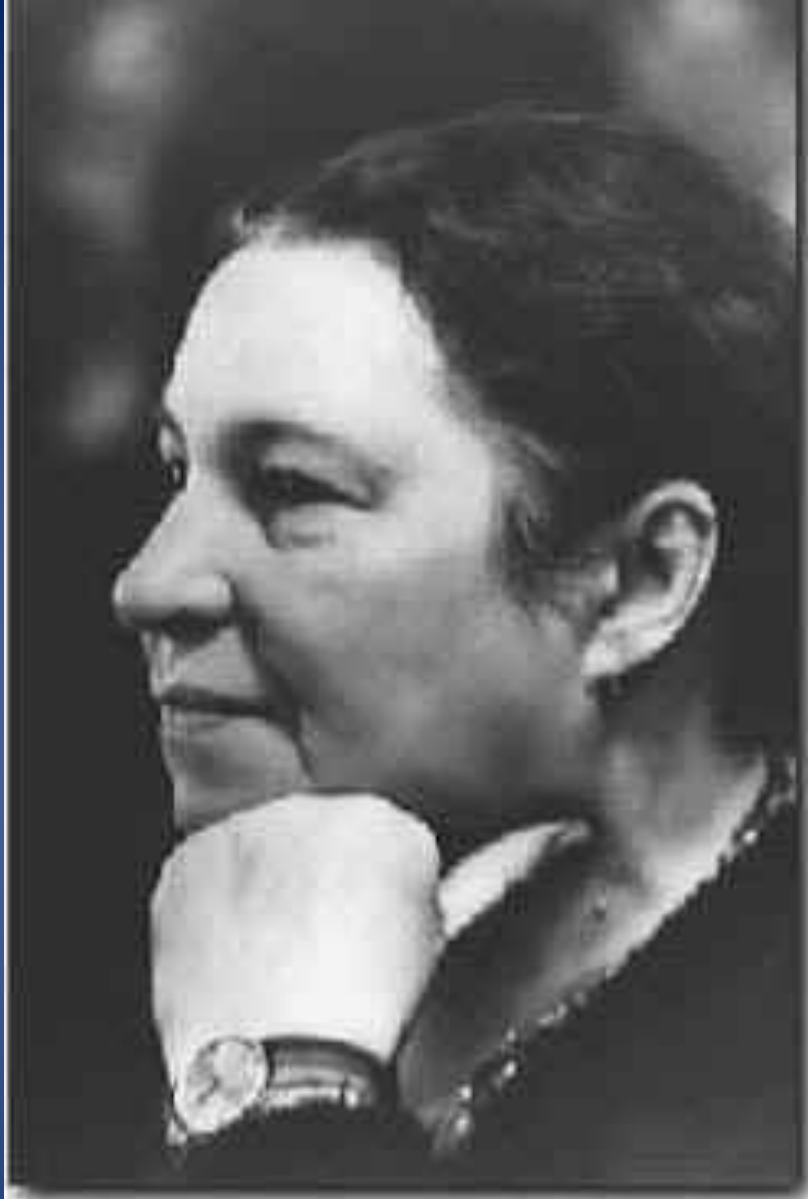
Агния Львовна Барто