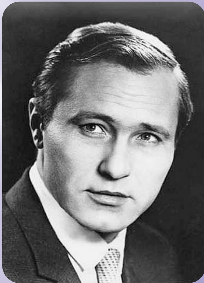
В. Шукшин «Срезал»