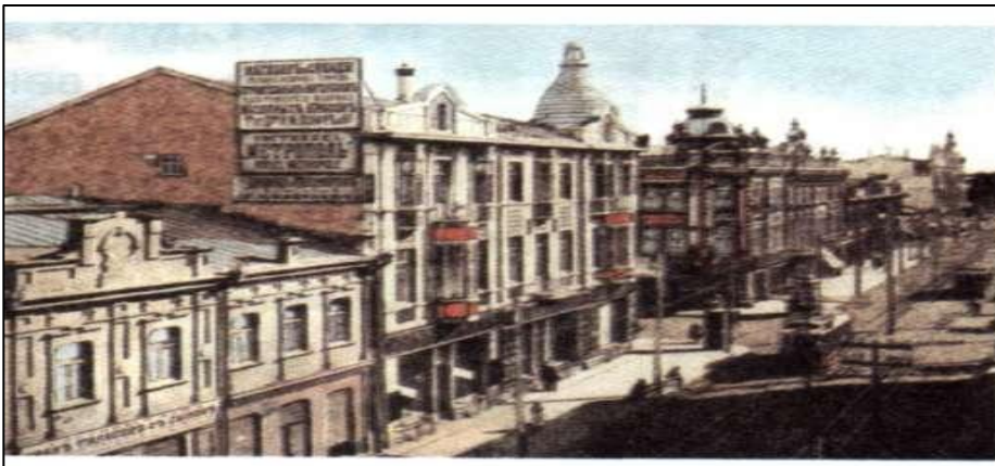
Первый трамвай на ул. Красной

В нём было: 250 магазинов, 80 заводов, 8 церквей, 1 собор, 3 типографии. В городе появились водопровод, электричество, телефон, а 10 декабря 1900 года побежал по рельсам первый трамвай.