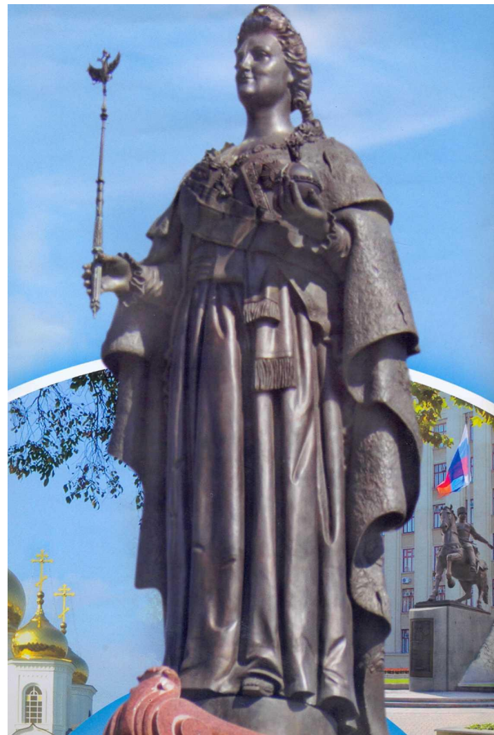
Памятник Екатерине Великой. 1907 г. Скульптор М. О. Микешин. Достраивал Б. В. Эдуардс.