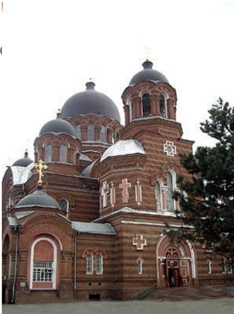
Собор св. Екатерины (архитектор И. К. Мальгерб