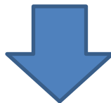
Схема отбора предприятий для получения мер поддержки со стороны государства кредиторов, собственников предприятия.

Совместный приказ «Критерии отнесения предприятий к