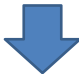
Схема отбора предприятий для получения мер поддержки со стороны государства кредиторов, собственников предприятия.

Совместный приказ «Критерии отнесения предприятий к