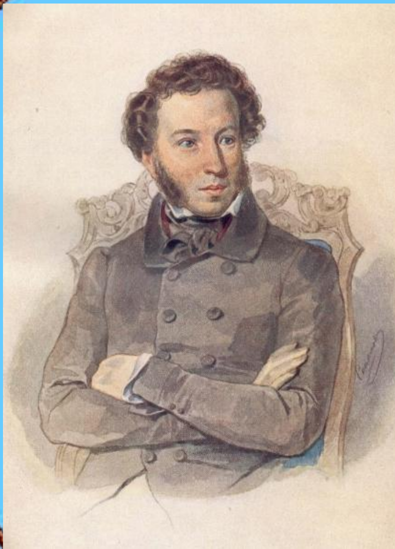
Александр Сергеевич Пушкин (1799 – 1837)