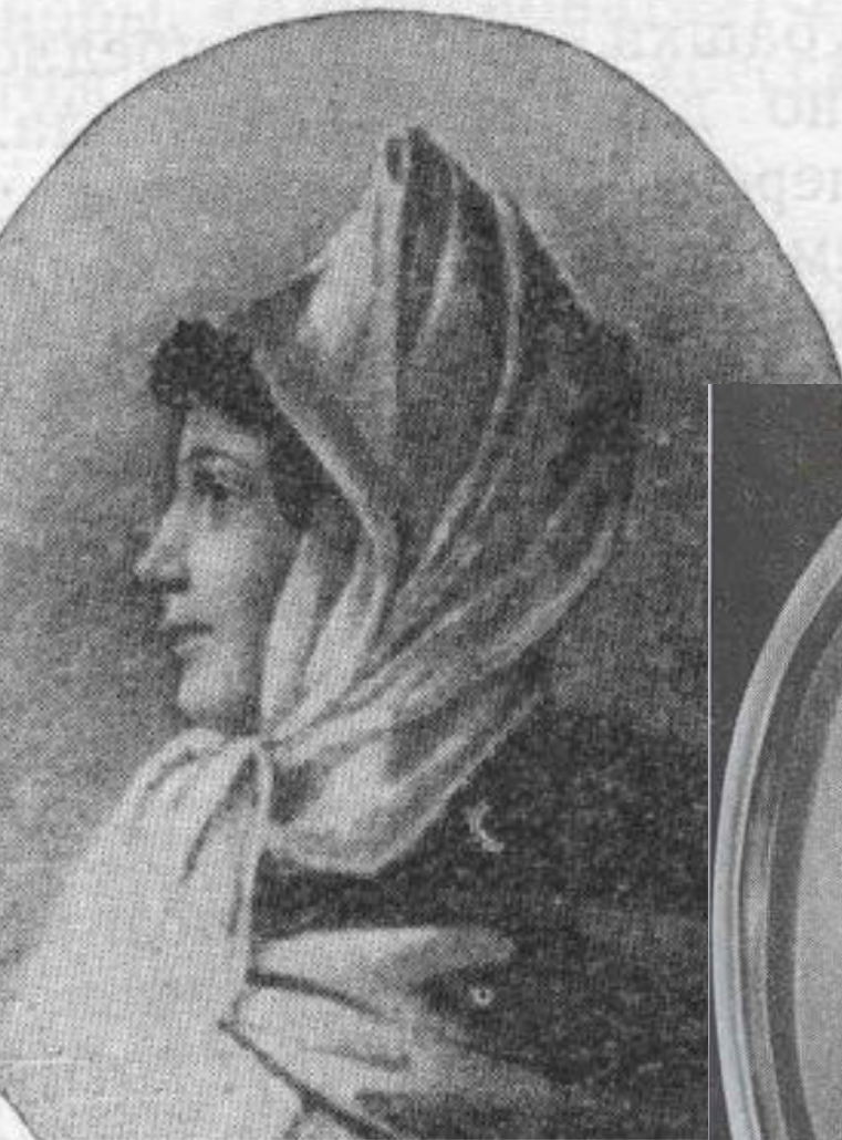
Джульетта Гвиччарди С портрета неизвестного художника