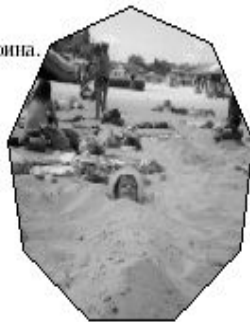
таким летом, собирала ракушки и привозила красивые вещи.

мысли, начался ливень. Было очень темно и страшно, все промогло. Начался шторм с торнадо, под ногами текли потоки воды и камней. Мама укутала меня в спальный мешок, но он сразу промог. Старшие ребята помогали нам. А у подножия горы нас встречали акулы, жупыры и акулы. Разместились в кемпинге, в палатках. А утром дали литры молока от горных коров. Это было очень вкусное молоко. Уходя, мы получили подарки от хороших людей. Потом мы катались на теплоходе, ходили в аквапарк. Но больше всего мне понравилось море и пляж. Я