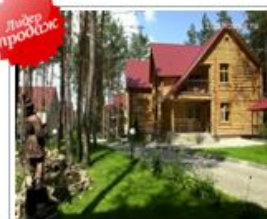
Белгородская обл., Шебекинский р-н, п. Титовка Цены от 2900 руб.