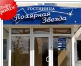
пр-т Хмельницкого, д. 135д Цены от 1700 руб.