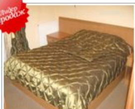
Белгород, пр-т Славы, д. 35а Цены от 2500 руб.