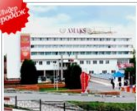
пр. Ватутина, д. 2 Цены от 2200 руб.