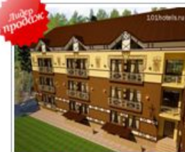
ул. Волчанская, д. 292/Б Цены от 1900 руб.