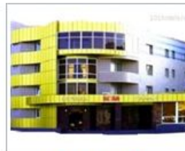
пр. Славы, д. 125а Цены от 3150 руб.