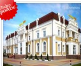
ул. Магистральная, д. 55 Цены от 1800 руб.