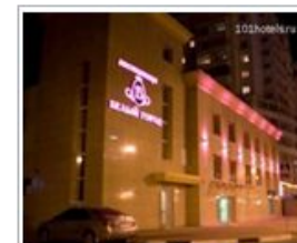
б-р. Народный, д. 34а Цены от 2900 руб.