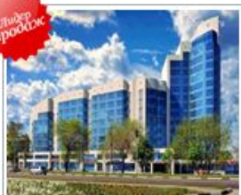
ул. Щорса, д. 86 Цены от 2300 руб.