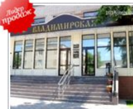
ул. Сумская, д. 20 Цены от 1600 руб.