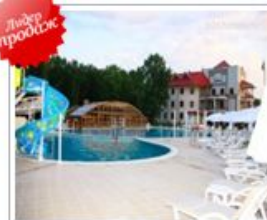
Белгород, ул. Песчаная, д. 1а Цены от 3500 руб.