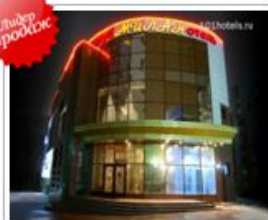
ул. Костокова, д. 34а Цены от 2500 руб.