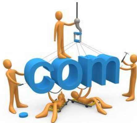
Создание современных и эффективных сайтов