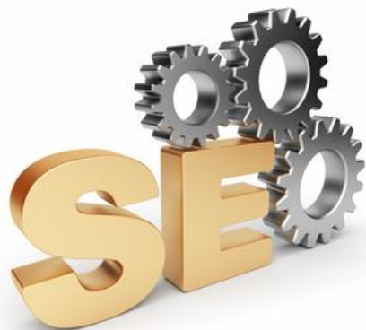
Поисковое продвижение сайтов - seo