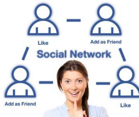
Social media marketing - (smm)