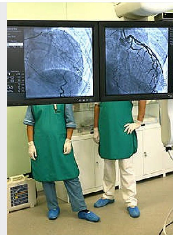
Проблемы финансирования ставят барьер между врачами и пациентами

У государства заканчиваются деньги на лечение собственных граждан. Годовые квоты на получение высокотехнологичной медицинской помощи — под это определение попадают 20 важнейших областей медицины — были исчерпаны на 80% уже к середине августа. В больницах и благотворительных фондах рассказывают, что операции переносятся на срок от трех до шести месяцев, а пациентов предупреждают, что срочно лечить их будут только за их же деньги.