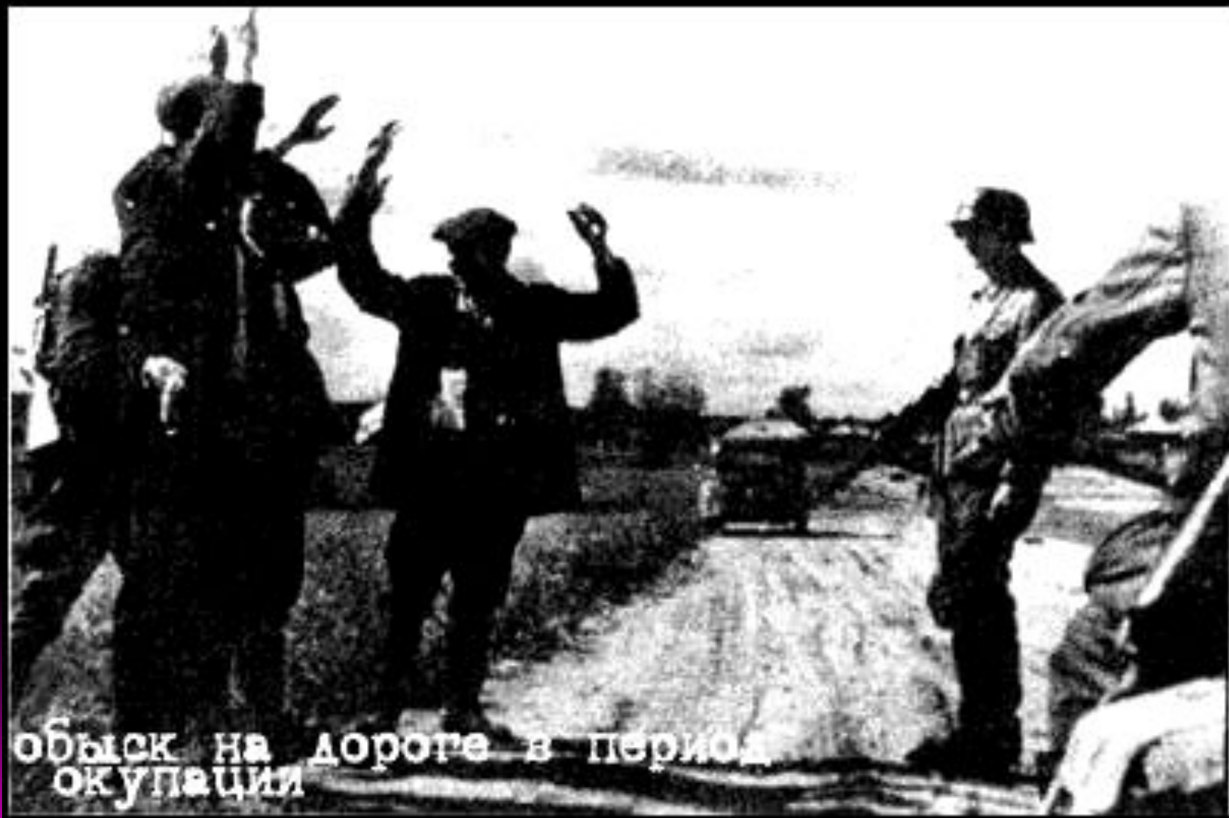
обыск на дороге в период оккупации