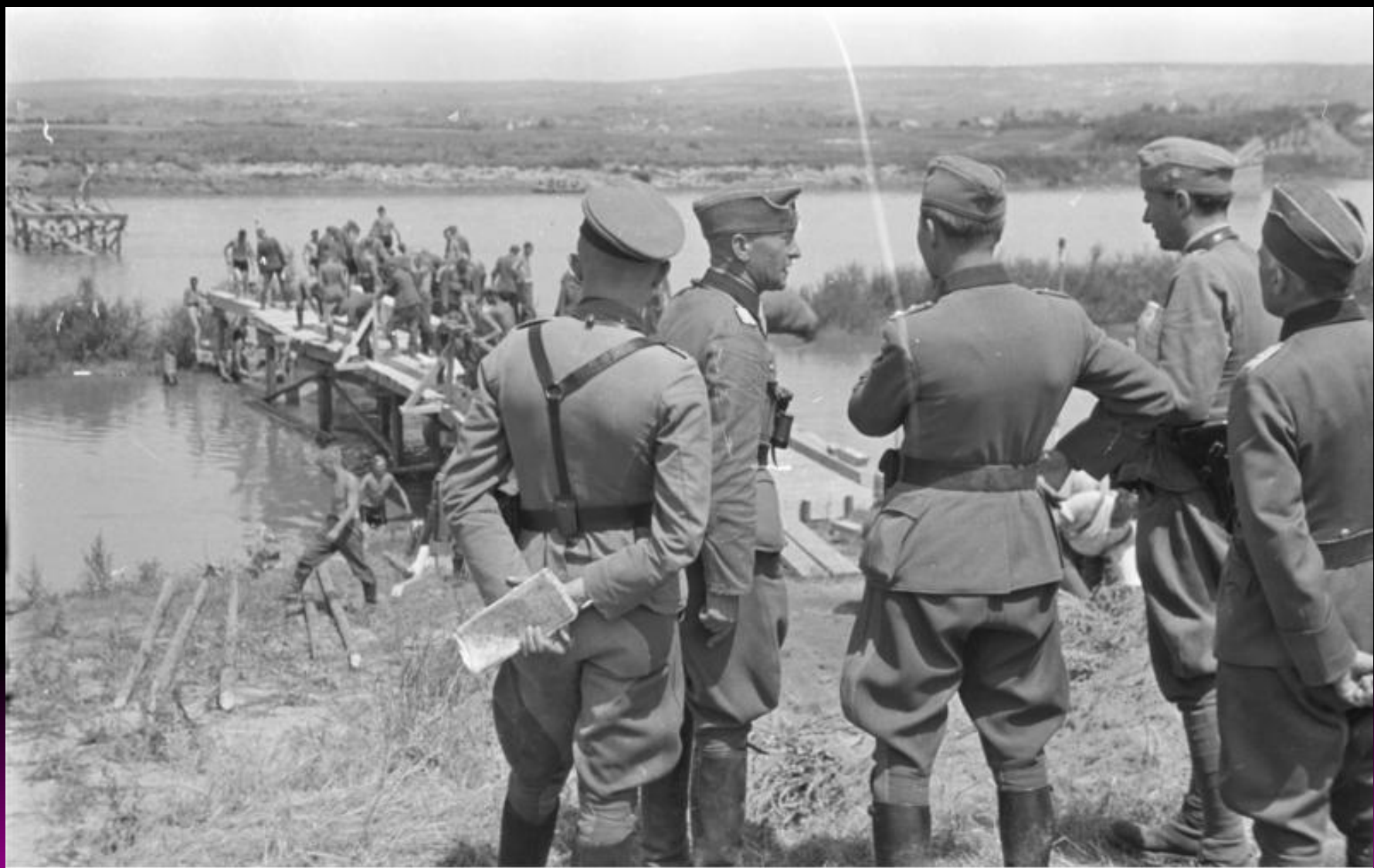
1. Juli 1941