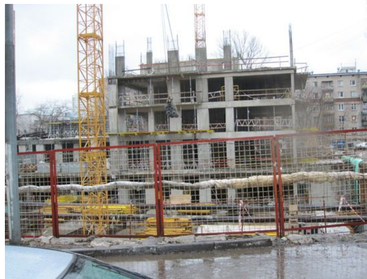
Технадзор и экспертиза объемов и качества при строительстве многоквартирного жилого дома