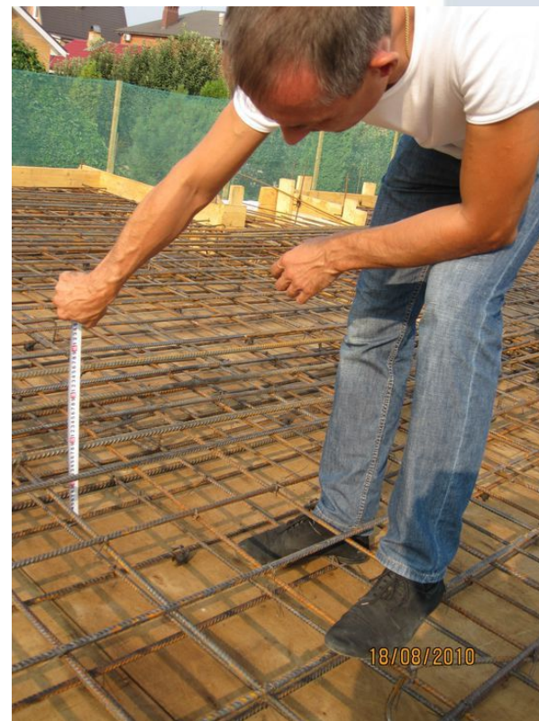
Контроль устройства защитного слоя бетона плиты перекрытия первого этажа при строительстве коттеджа