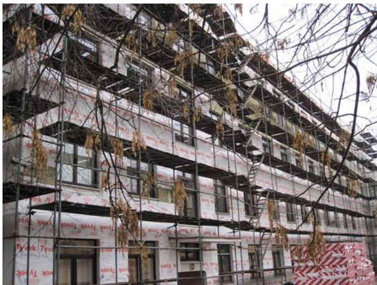
Технический надзор за устройством вентилируемого фасада детской поликлиники.