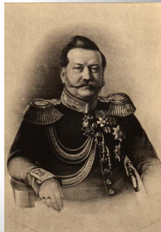
Яковъ Ив. РОСТОВЦЕВЪ. Предсѣдатель Комитета по освобожденію крестьянъ. (1802—1860)