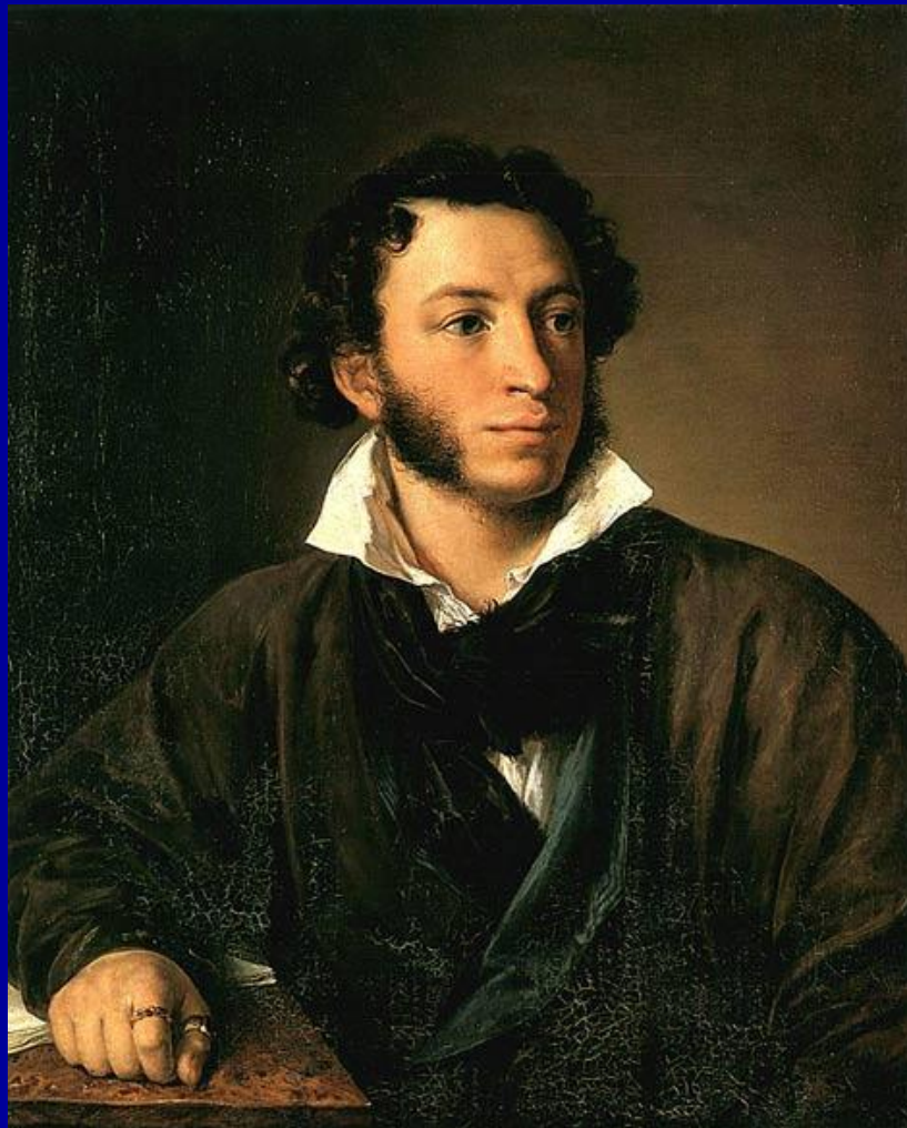
Пушкин Александр Сергеевич