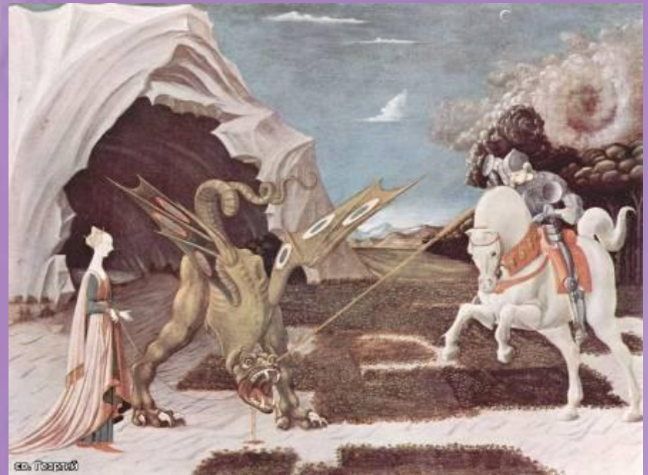
Паоло Уччелло (1397-1475)