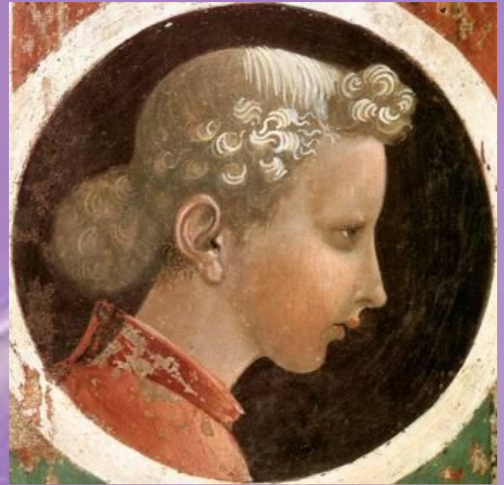
Паоло Уччелло (1397-1475)