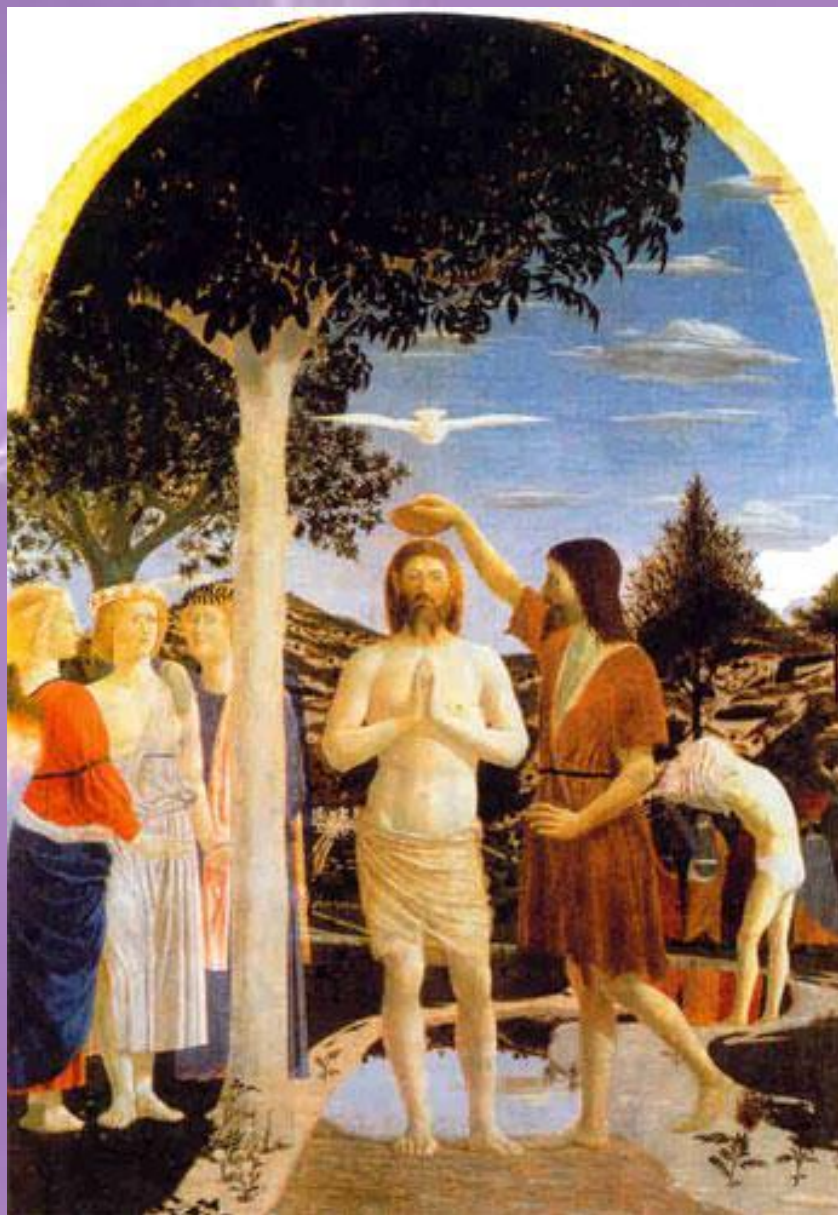
Пьеро делла Франческа (1420-1492)