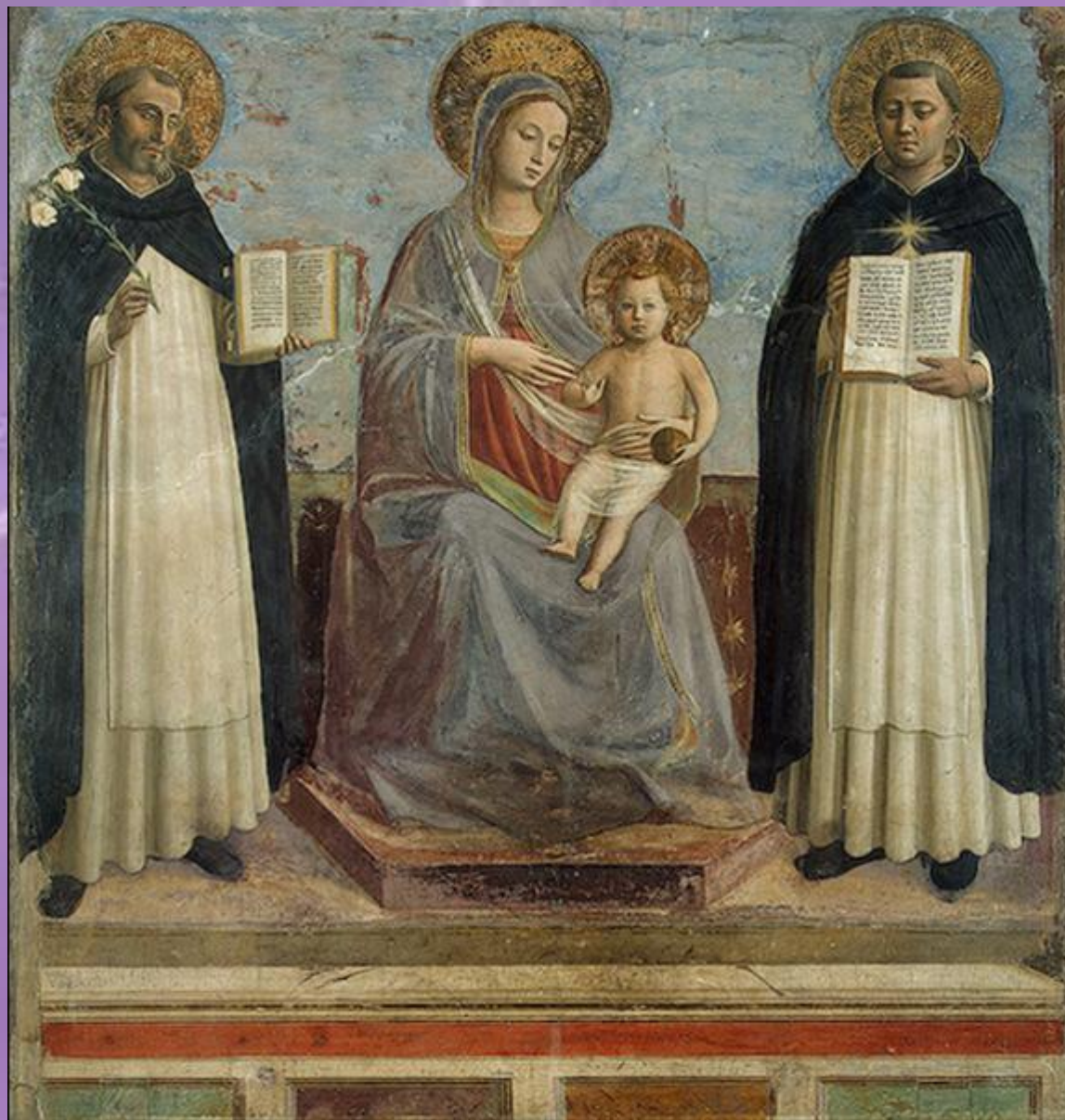
«Мария с младенцем, святыми Домиником и Фомой Аквинским»