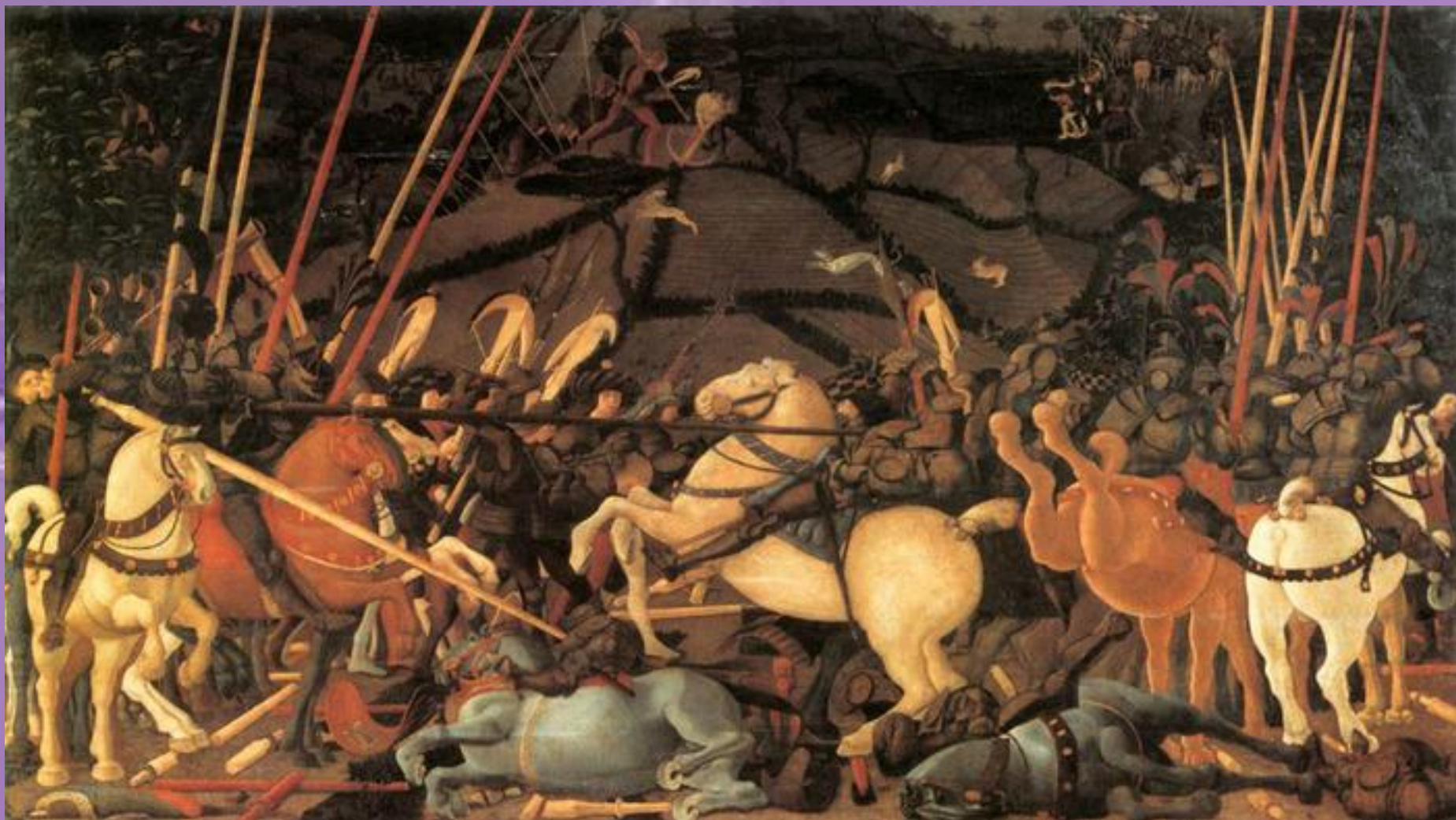
Битва при Сан-Романо