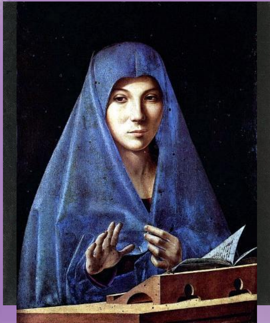
Портреты Антонелло да Мессина (1430-1479)