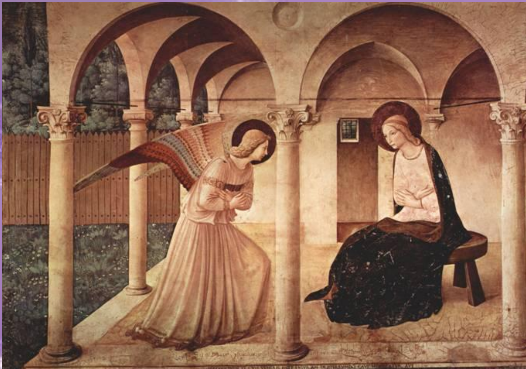
Фра Беато Анджелико (1400-1455) «Благовещение»