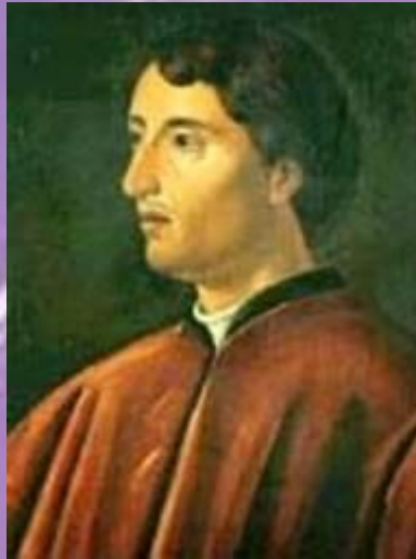
Леон Баттиста Альберти (1404-1472)

«Мы, живописцы, при помощи движений тела хотим изобразить движения души... а поэтому художники должны в совершенстве знать движения тела, научиться им у природы, чтобы уметь подражать, как бы это ни было трудно, многообразным движениям души... Кто бы мог без основательного изучения изобразить такое лицо, на котором рот, подбородок, глаза, лоб вместе смеются или плачут? Надо так учиться у природы, чтобы уметь ухватить самые мимолетные мгновения, такие, которые побуждают фантазию зрителя к большему, чем он видит».