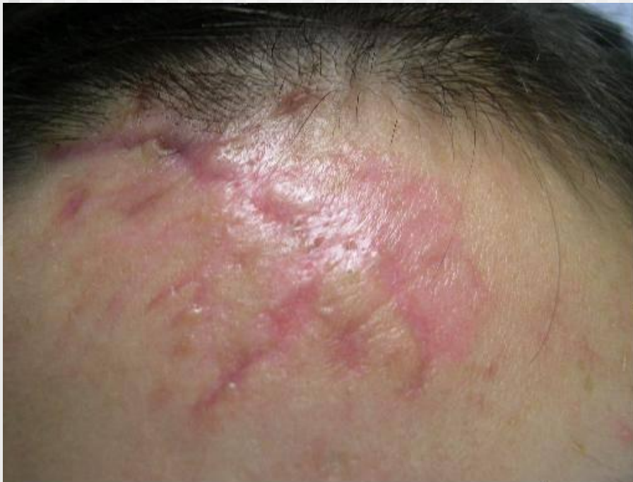
Pivkina do iposle 2 sessiy Yachroma