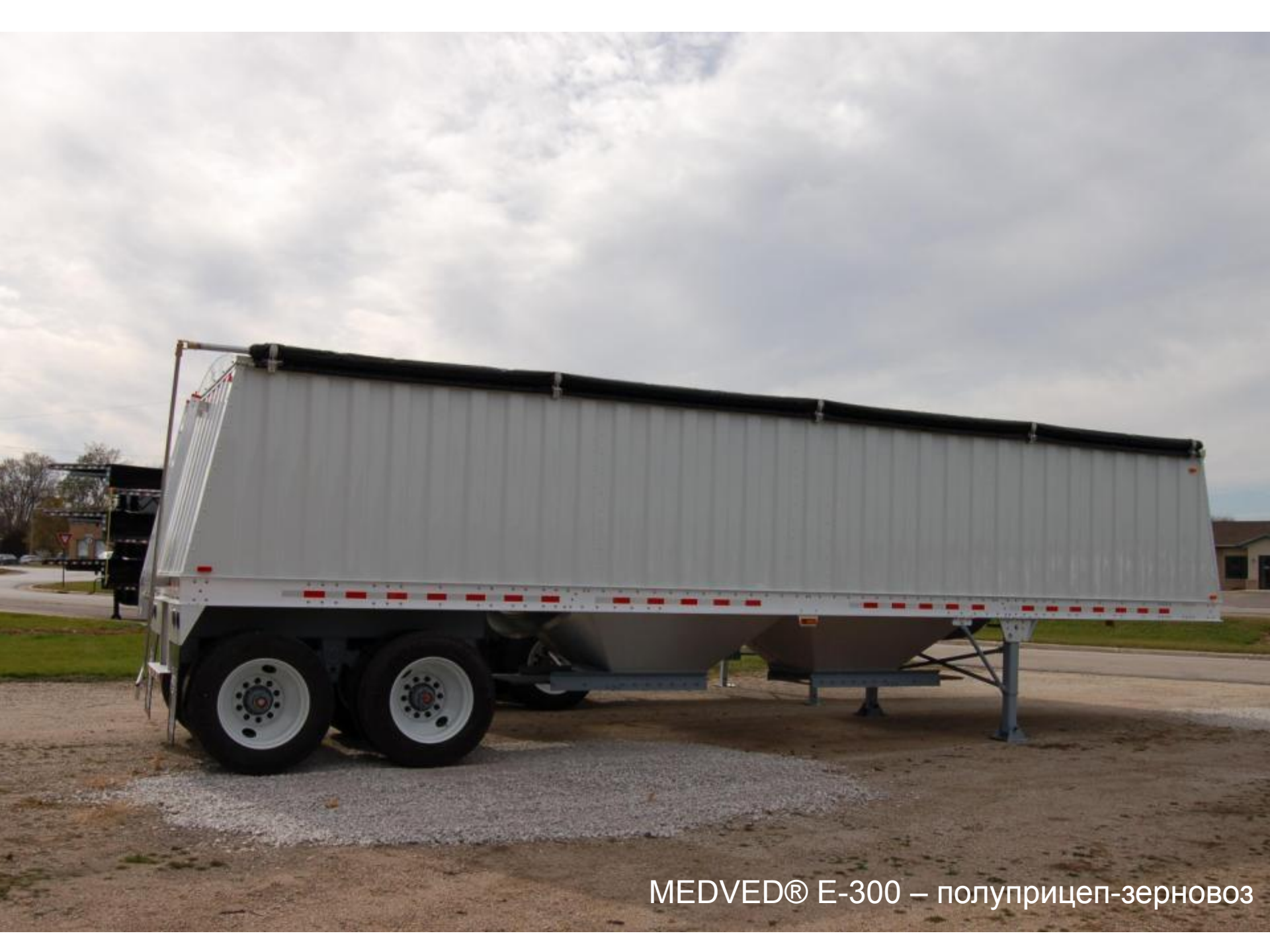
MEDVED® E-300 – полуприцеп-зерновоз