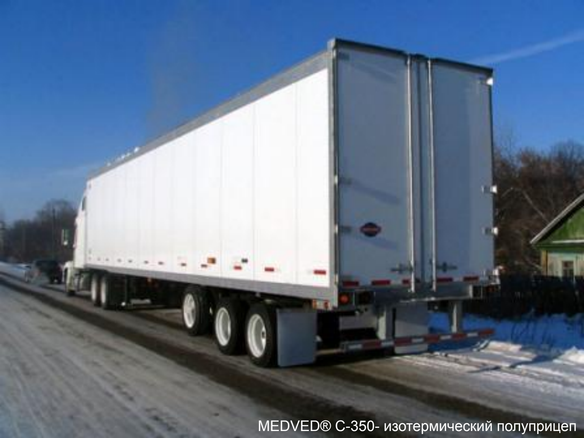
MEDVED® С-350- изотермический полуприцеп