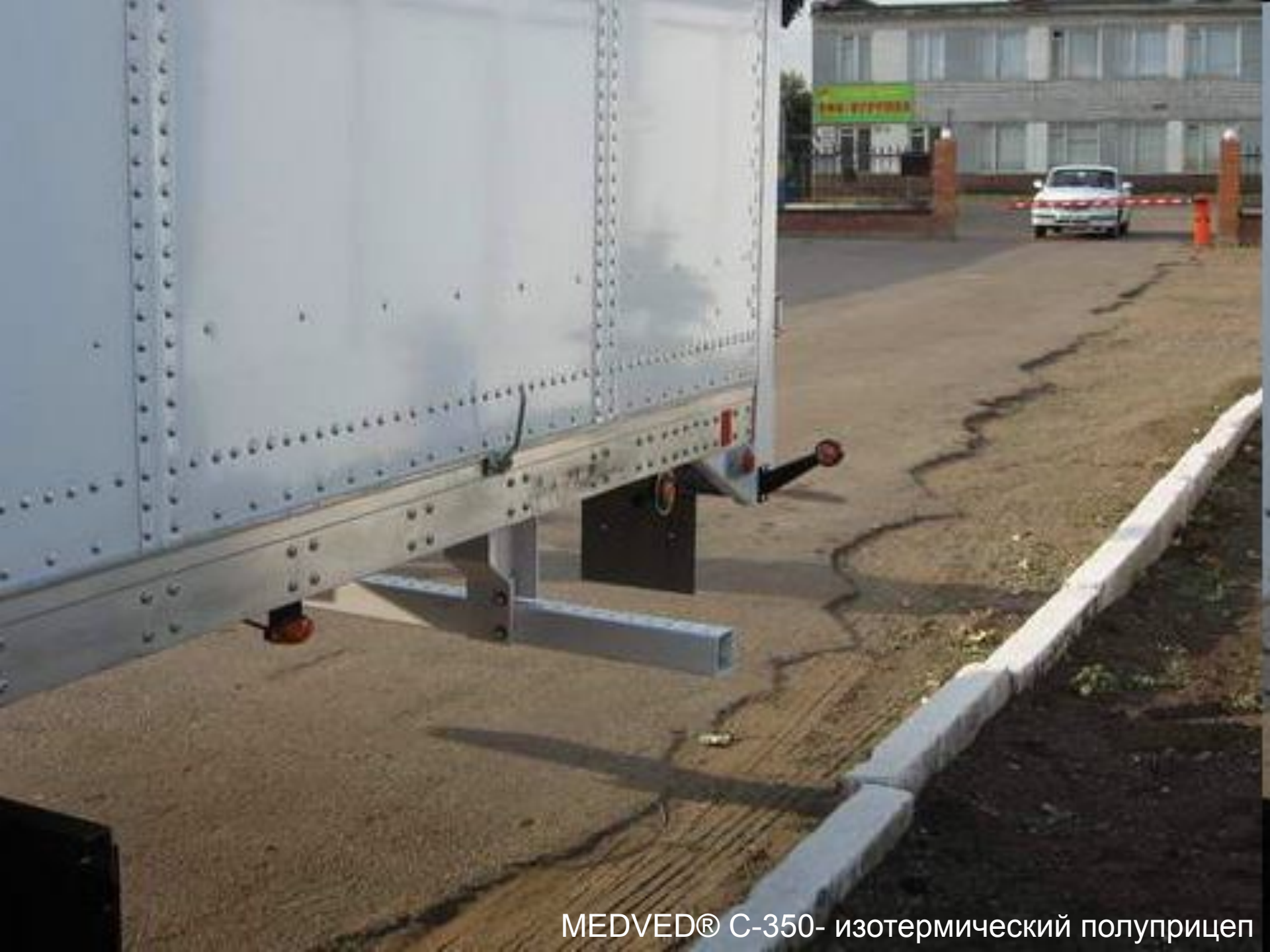
MEDVED® С-350- изотермический полуприцеп