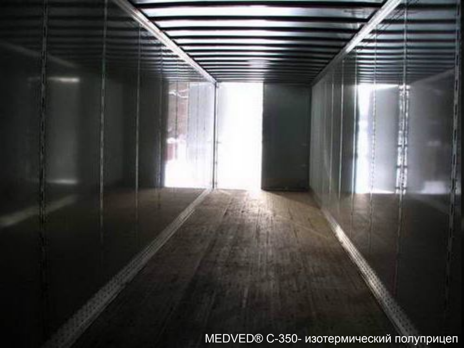
MEDVED® С-350- изотермический полуприцеп