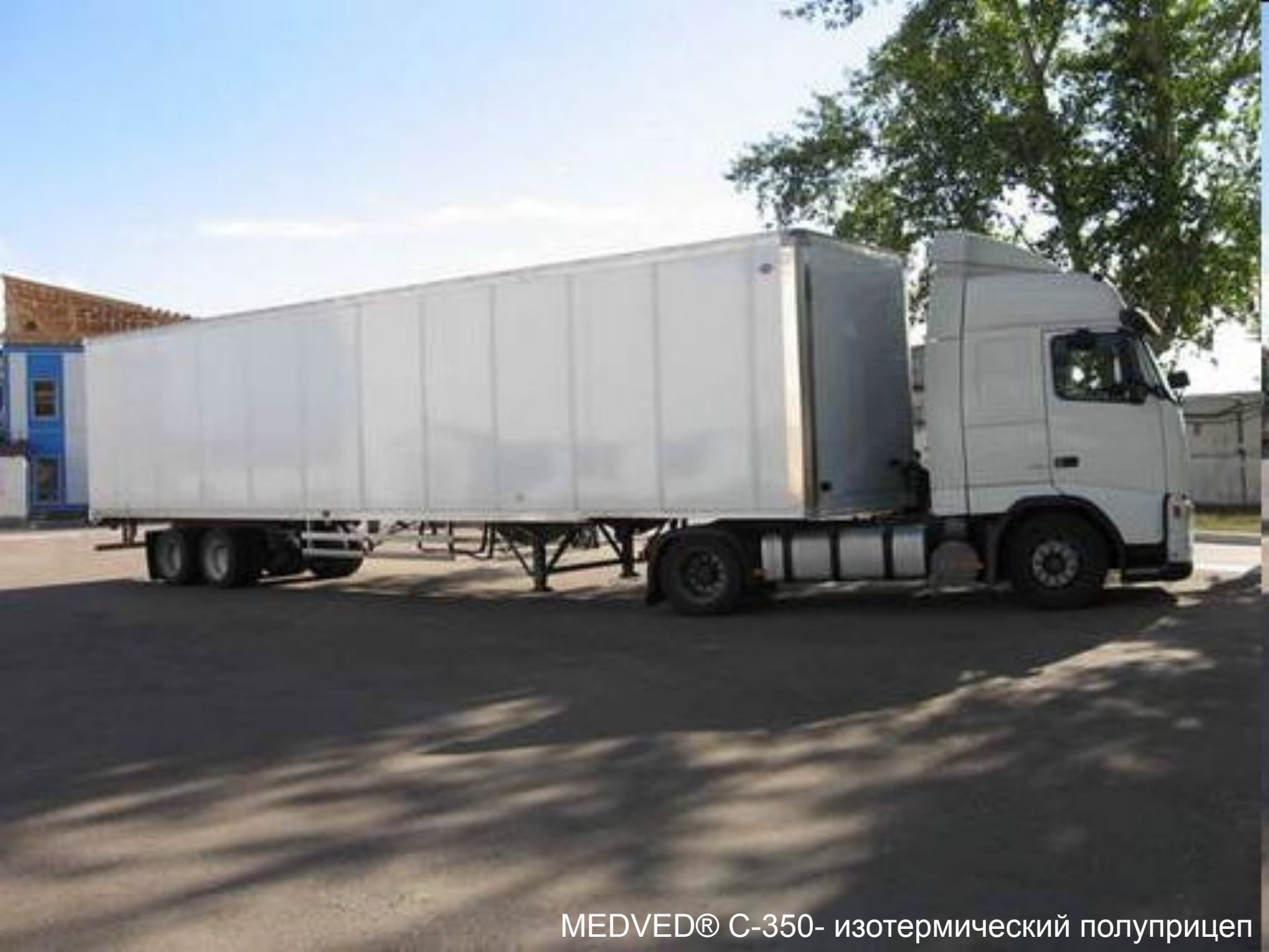
MEDVED® С-350- изотермический полуприцеп