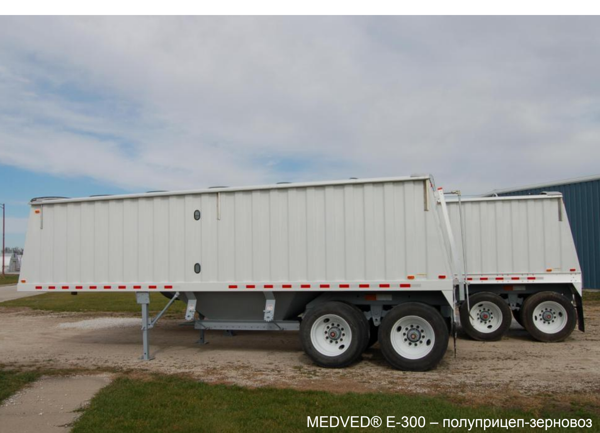
MEDVED® E-300 – полуприцеп-зерновоз