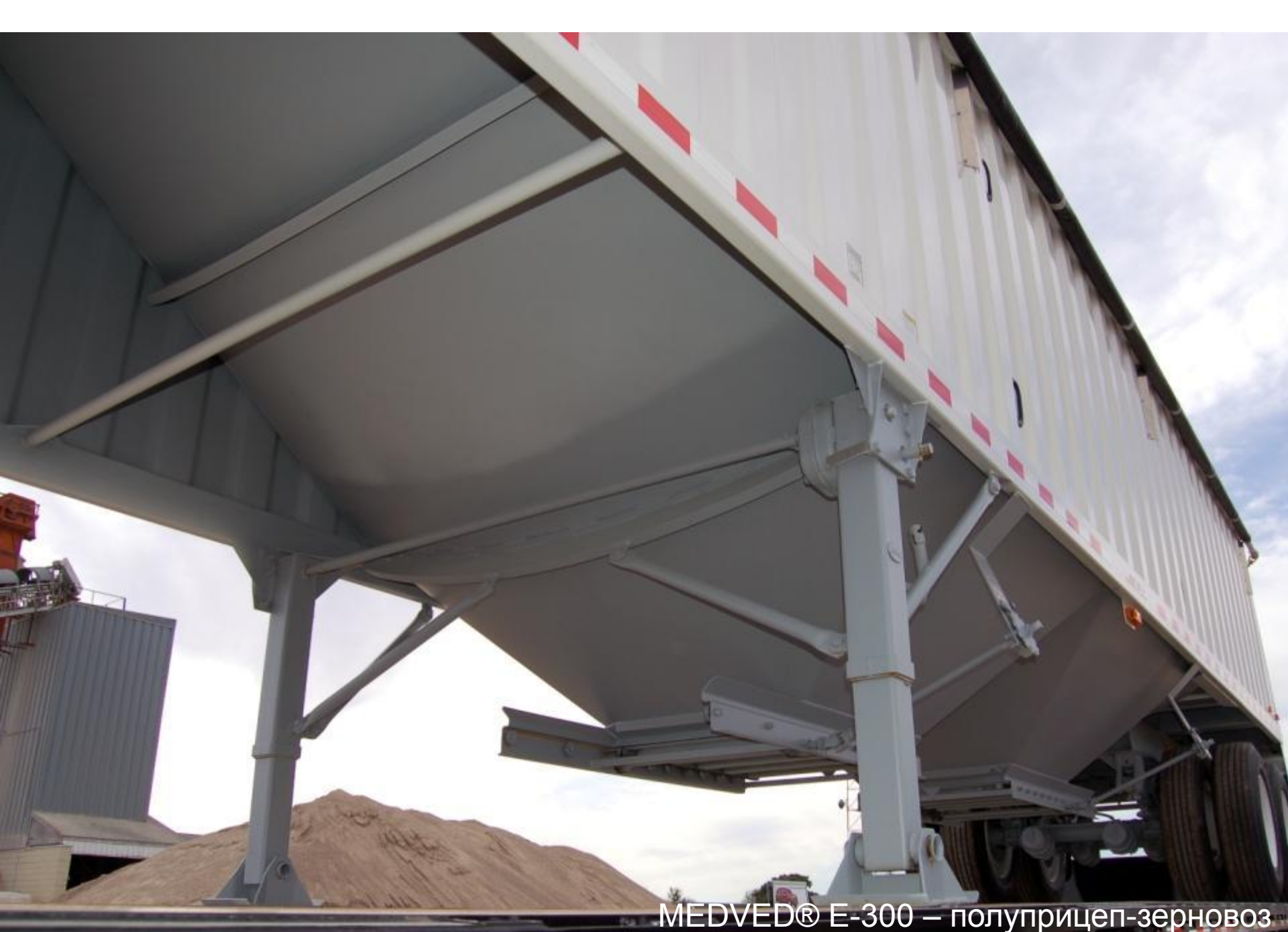
MEDVED® E-300 – полуприцеп-зерновоз