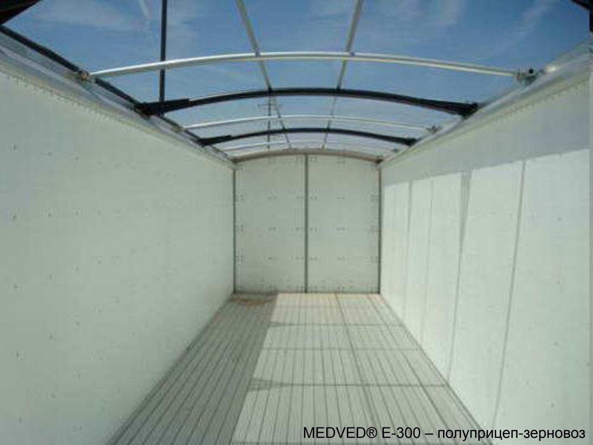
MEDVED® E-300 – полуприцеп-зерновоз