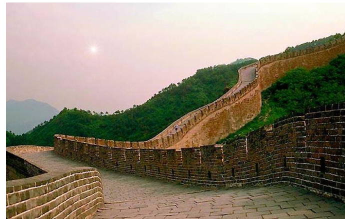
Великая китайская стена