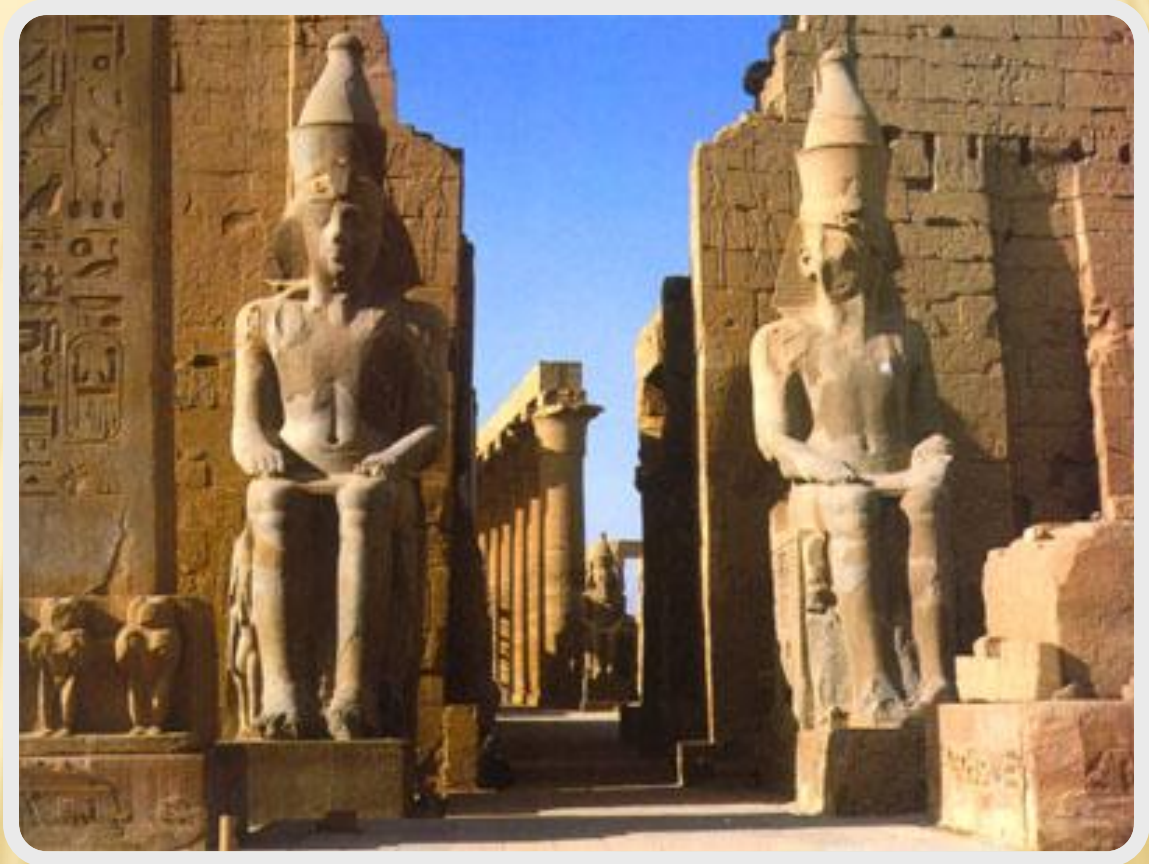
Вход в храмовый комплекс Луксор

Был воздвигнут в эпоху Нового Царства. Представляет собой огромный храмовый комплекс, а также знаменитые колоссы Мемнона.