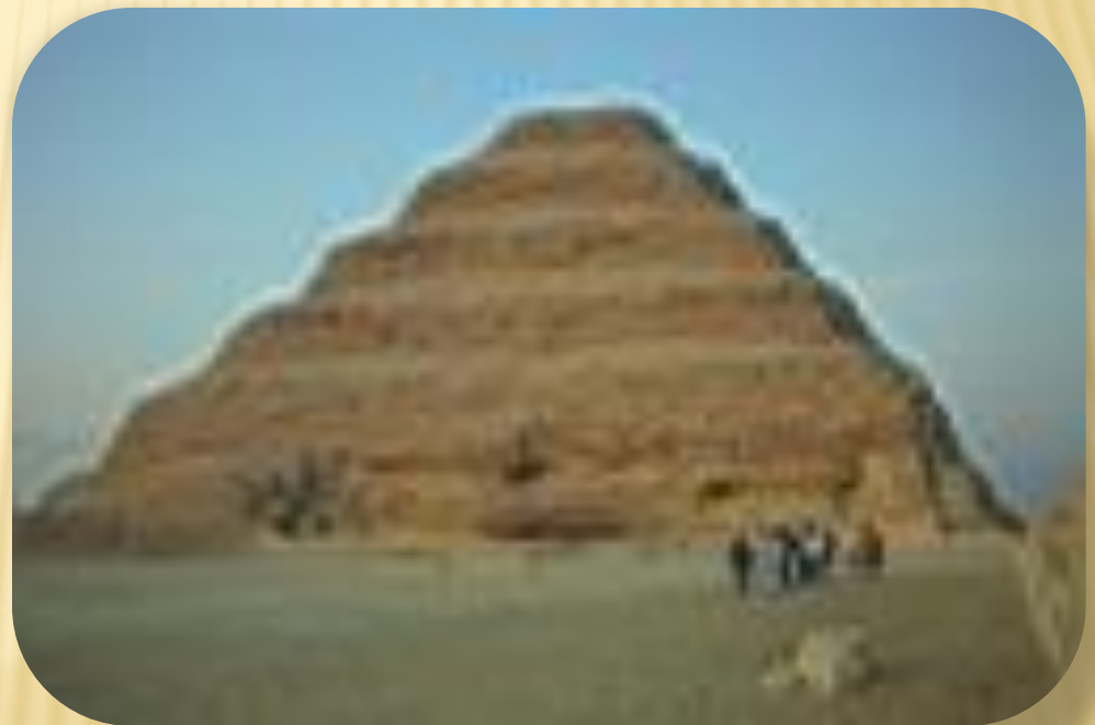
Ступенчатая пирамида в Саккара

Первая пирамида, построенная в Египте, была ступенчатой. Ее воздвиг жрец и архитектор Имхотеп для фараона III династии Джосера около 4 тысяч лет назад.