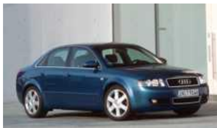
Audi A4 (B6) 2000 - 2004