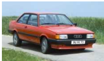
Audi 80 (B2) 1978 - 1986