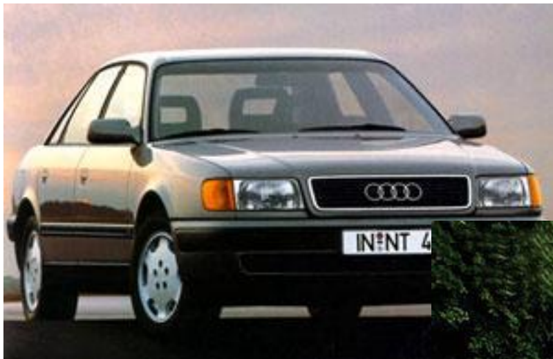
Ауди 100 (A6) 1994-1996