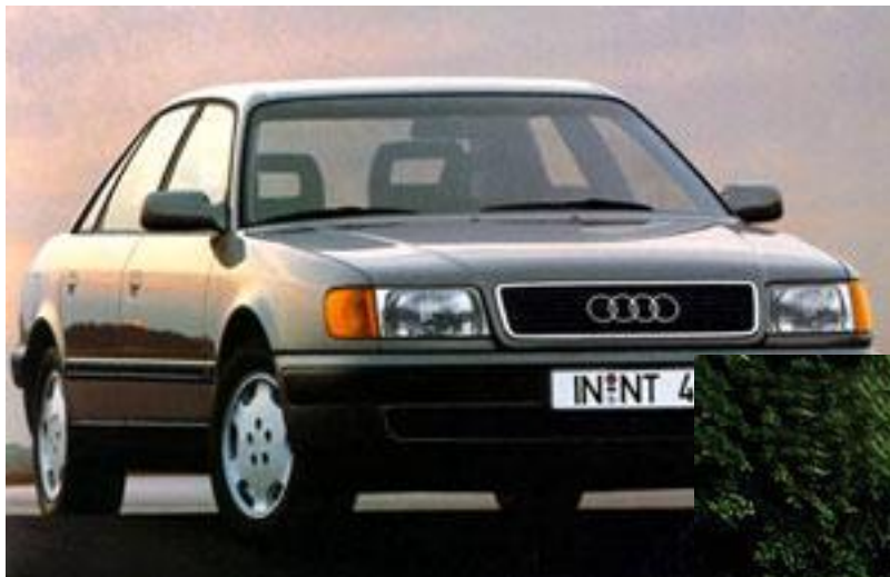
Ауди 100 (А6) 1994-1996