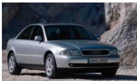
Audi A4 (B5) 1994 - 2000