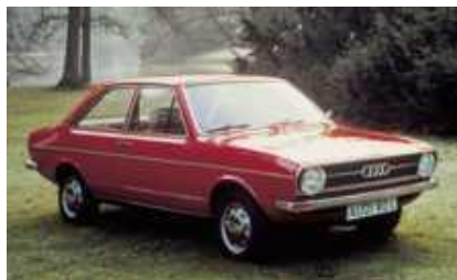
Audi 80 (B1) 1972 - 1978