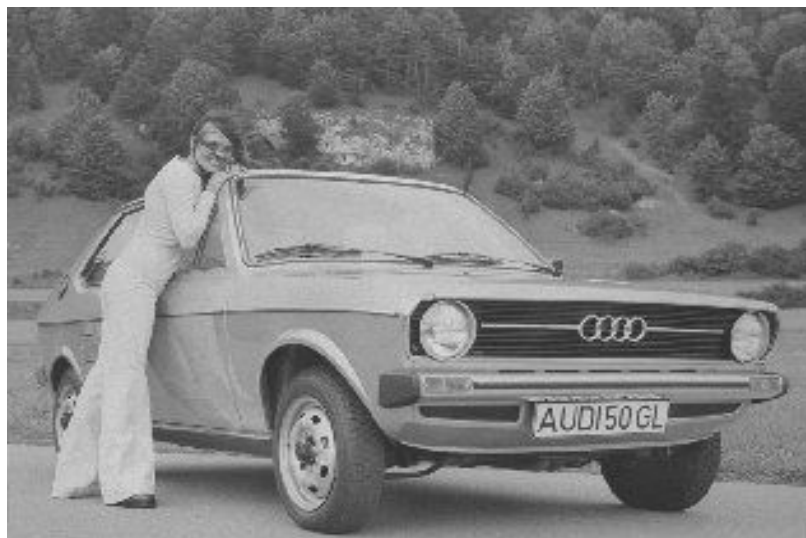
1974г. Audi 50- основатель класса