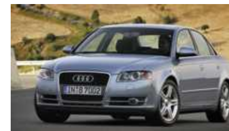
Audi A4 (B7) 2004 - 2007