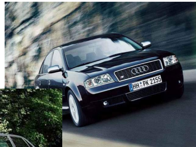
Ауди А6 1997-2003