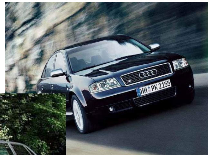
Ауди A6 1997-2003