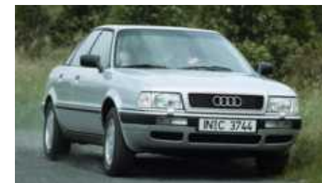
Audi 80 (B4) 1991 - 1994