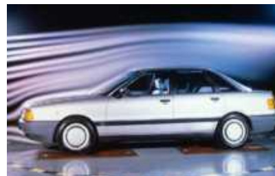
Audi 80 (B3) 1986 - 1991