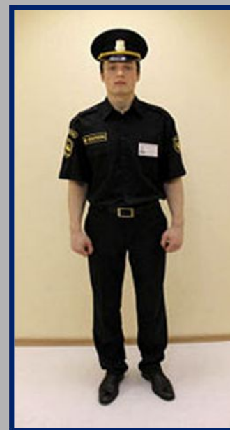
ЛЕТНЯЯ ФОРМА ОХРАННИКА