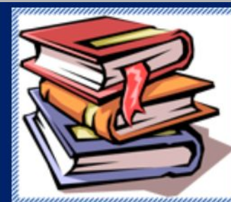
Федеральное учреждение Московский Учебно-Курсовой Комбинат