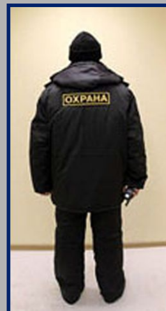
ЗИМНЯЯ ФОРМА ОХРАННИКА