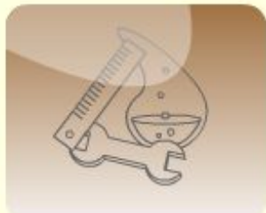
Практикум по курсу