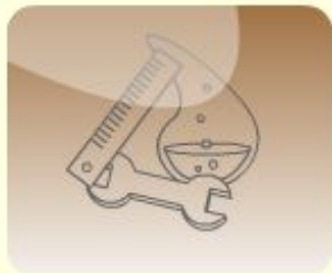
Практикум по курсу