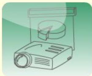
Презентация по курсу