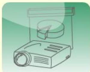
Презентация по курсу