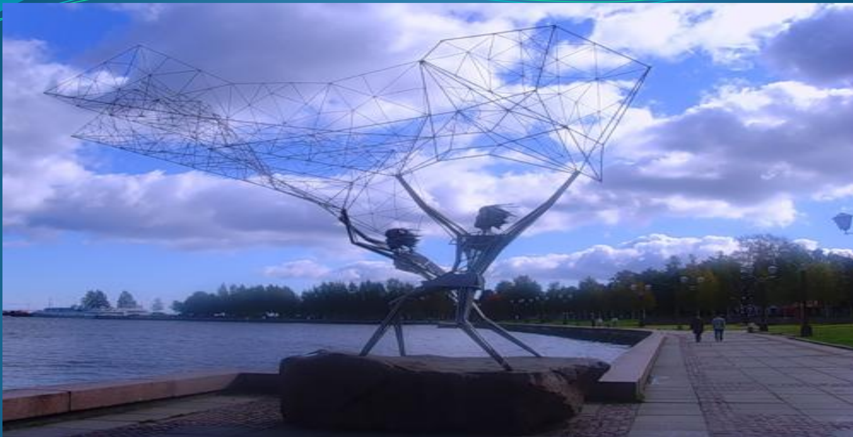
Скульптура «Рыбаки», Петрозаводск