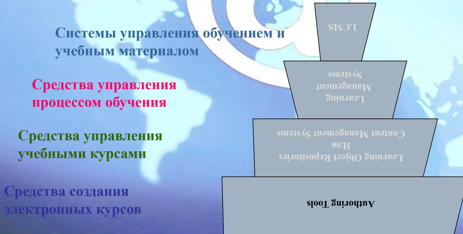
Рис. 1. Иерархия систем дистанционного обучения

Системы дистанционного обучения бывают различной степени сложности. Визуально иерархию систем дистанционного обучения можно представить в виде пирамиды, изображенной на рисунке 1.