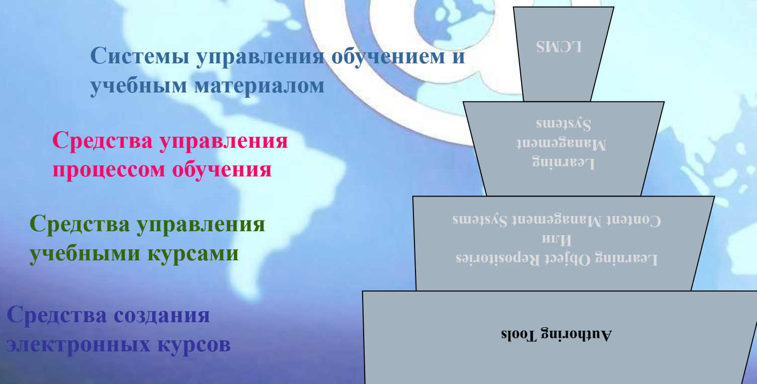
Рис. 1. Иерархия систем дистанционного обучения

Системы дистанционного обучения бывают различной степени сложности. Визуально иерархию систем дистанционного обучения можно представить в виде пирамиды, изображенной на рисунке 1.