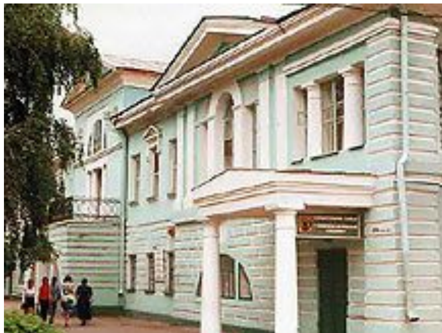
ДОМ КАЗАЧЬЕГО АТАМАНА

До усмирения Пугачевского бунта назывался Яицким городком (по старому названию реки Урал — Яик); в 1775 указом Екатерины II переименован в Уральск , «для предания всего случившегося полному забвению»