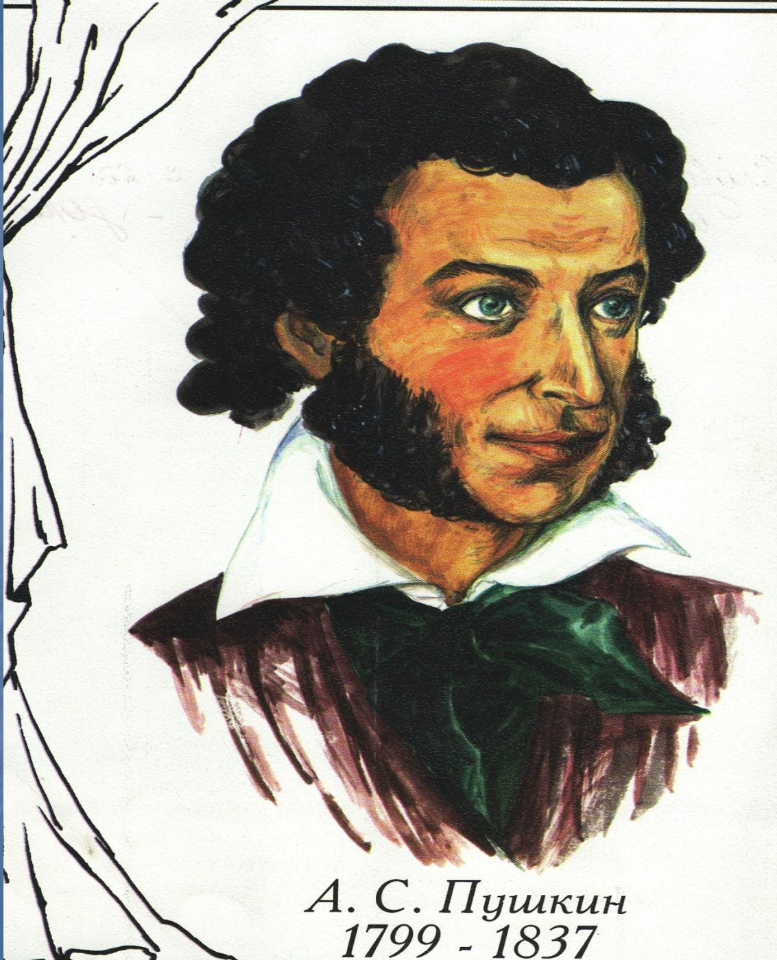
А. С. Пушкин 1799 - 1837