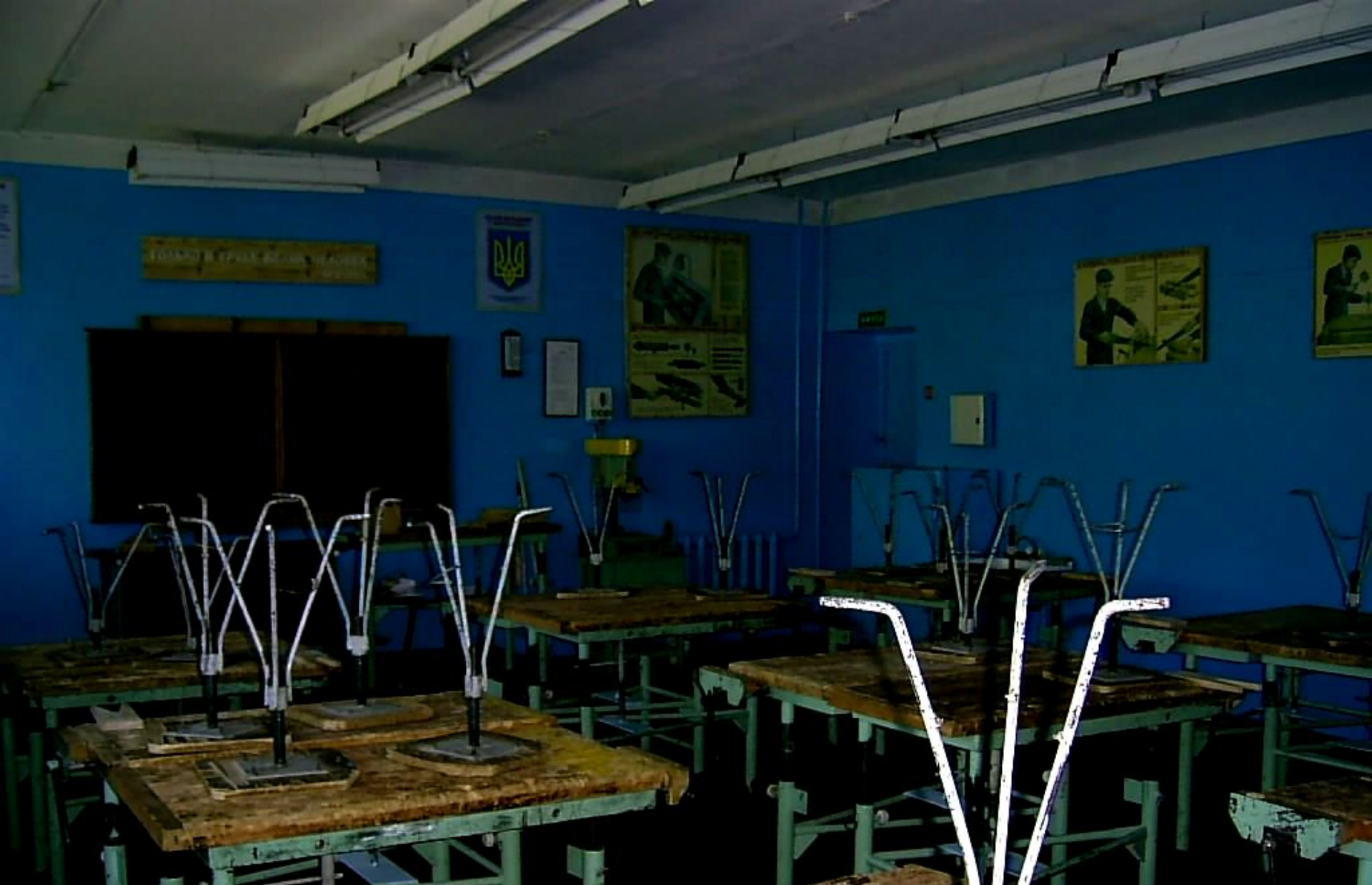
РЕМОНТ ДЕРЕВООБРАБАТЫВАЮЩИХ МАСТЕРСКИХ ТРУДОВОГО ОБУЧЕНИЯ