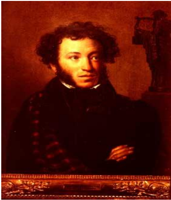
А.С.Пушкин 1799 - 1837