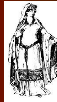
Мода эпохи Крестовых походов