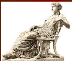
Мода Древней Греции