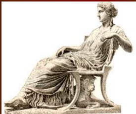
Мода Древней Греции