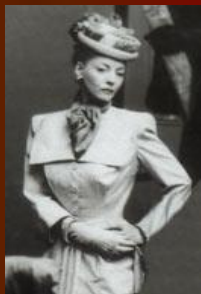
Военная мода 40-х