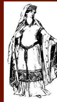
Мода эпохи Крестовых походов