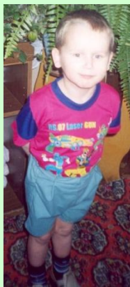
Фото на сайте органа опеки