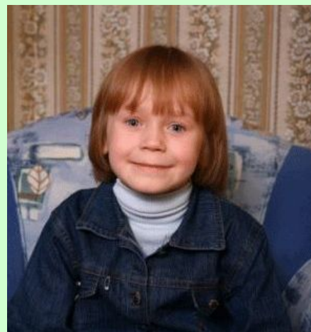
Фото в Банке данных