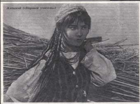
Алтынай («Первый учитель»)