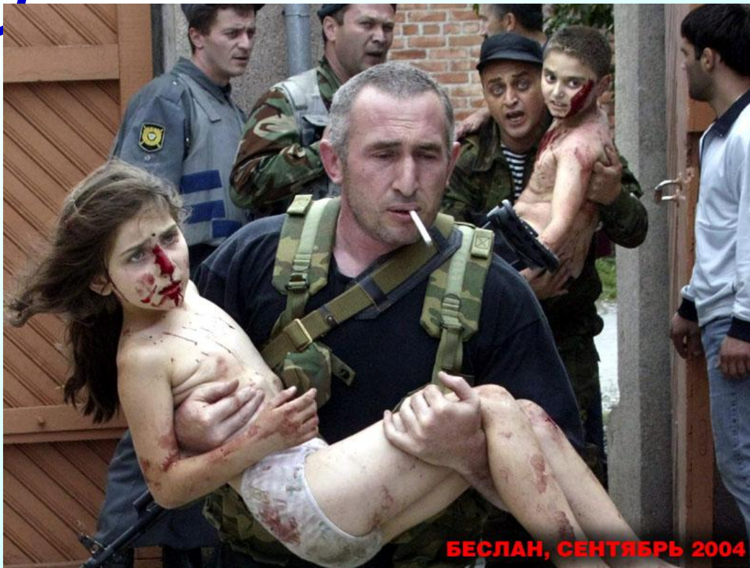
БЕСЛАН, СЕНТЯБРЬ 2004

http://matvey.org.ru/images/beslan/beslan-42.jpg