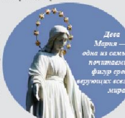
Дева Мария — одна из самых почитаемых фигур среди верующих всего мира

Всемирный день мира является выходным днем в Ватикане, в Ватикане отмечается под названием Всемирного дня братства.