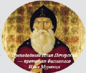
Преподобный Илия Петербургский — прототип великого Илья Муромца

Историю Илья Муромца называют светорусским богатырем, освободителем земли Русской, избавителем царя-града Киева от татарского Калык-царя. Илья Муромец вместе с богатырями Добрыней Никитичем и Алешей Поповичем — стражи великой Руси, символы могущества нашего Отечества, наравне с его доброй силой.