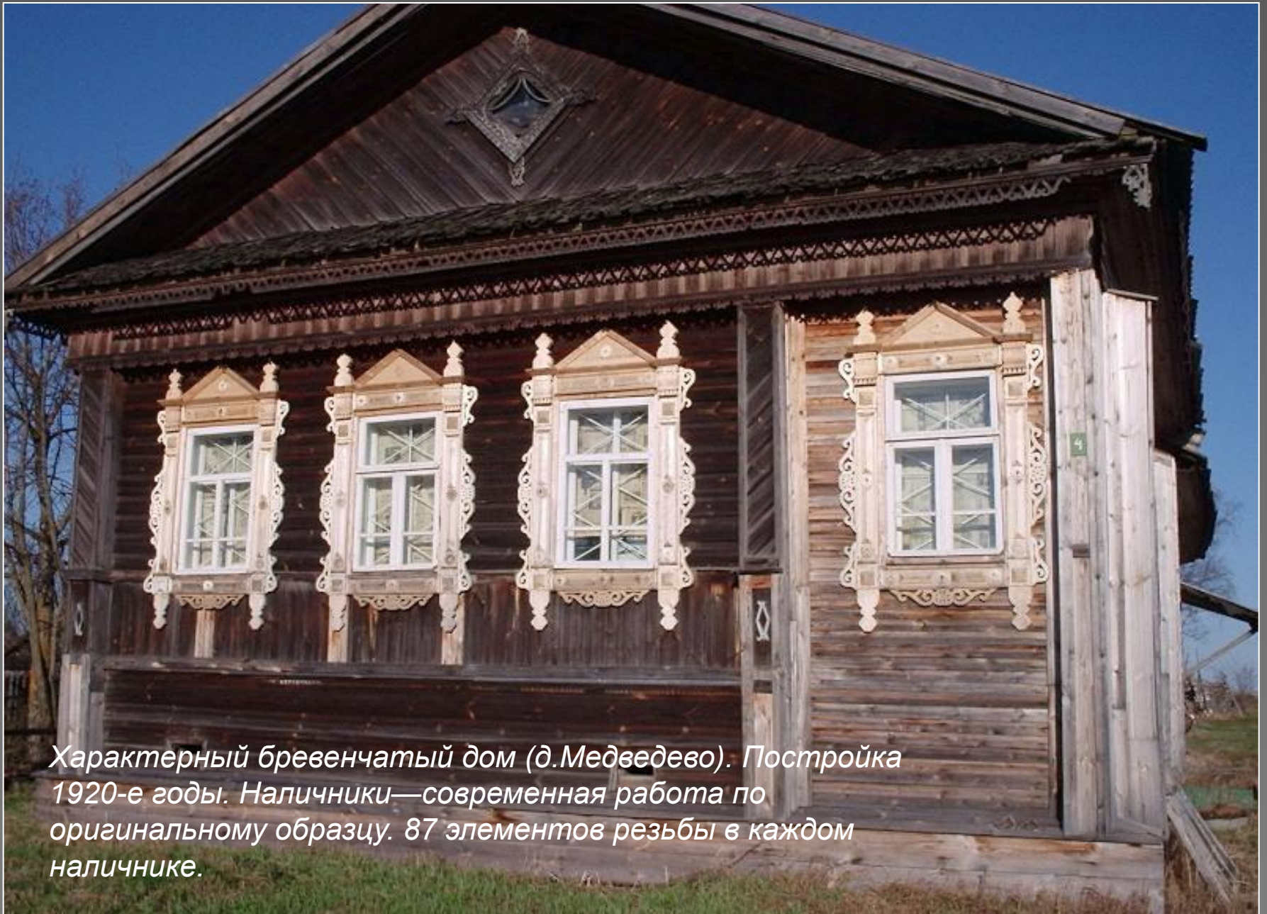
Характерный бревенчатый дом (д.Медведево). Постройка 1920-е годы. Наличники—современная работа по оригинальному образцу. 87 элементов резьбы в каждом наличнике.