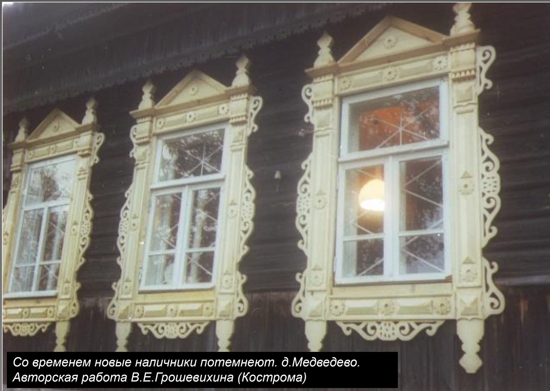
Со временем новые наличники потемнеют. д.Медведево. Авторская работа В.Е.Грошевихина (Кострома)