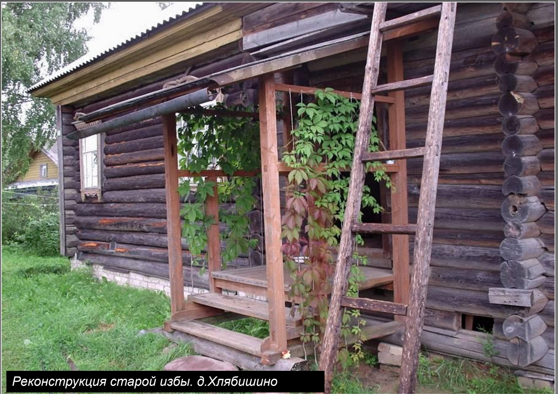
Реконструкция старой избы. д.Хлябишино