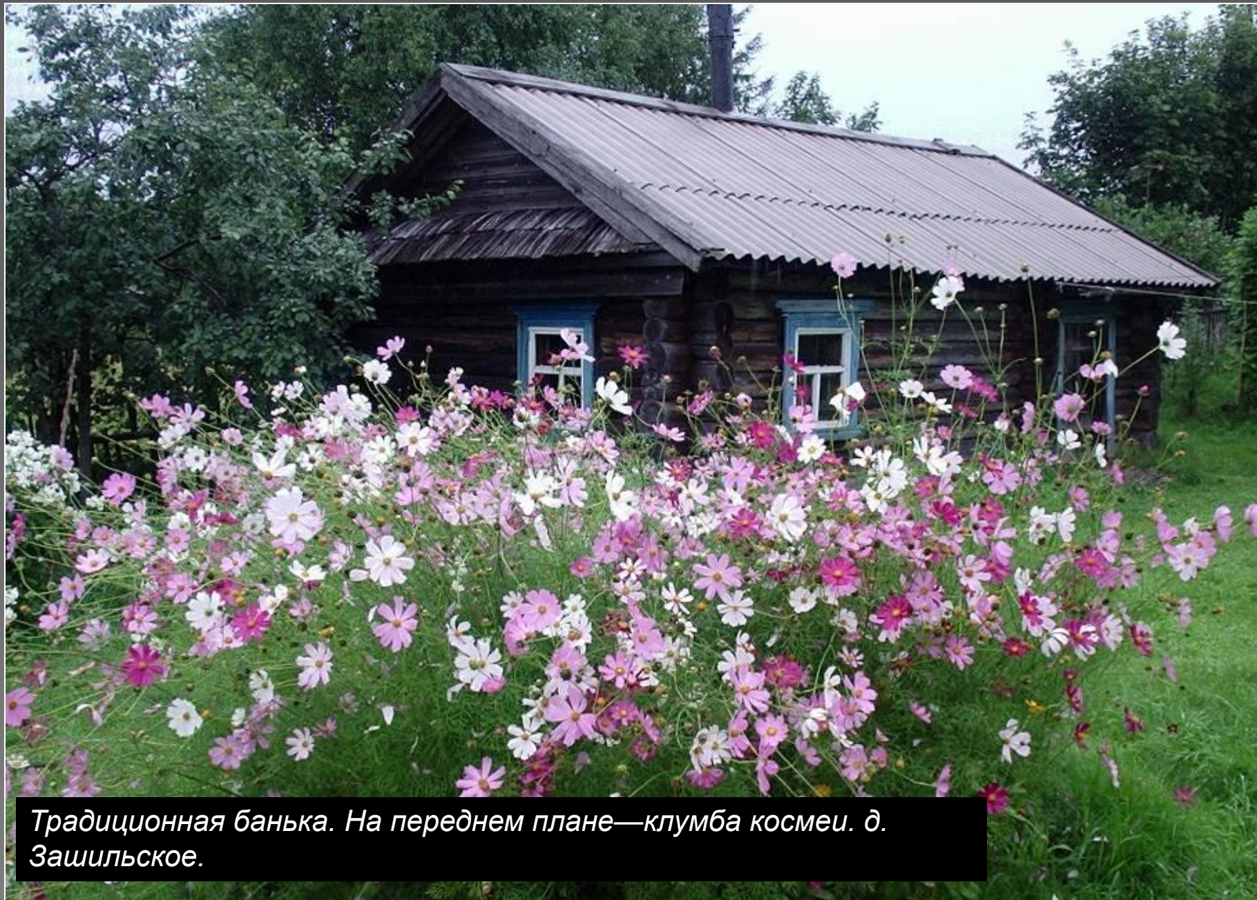
Традиционная банька. На переднем плане—клумба космеи. д. Зашильское.