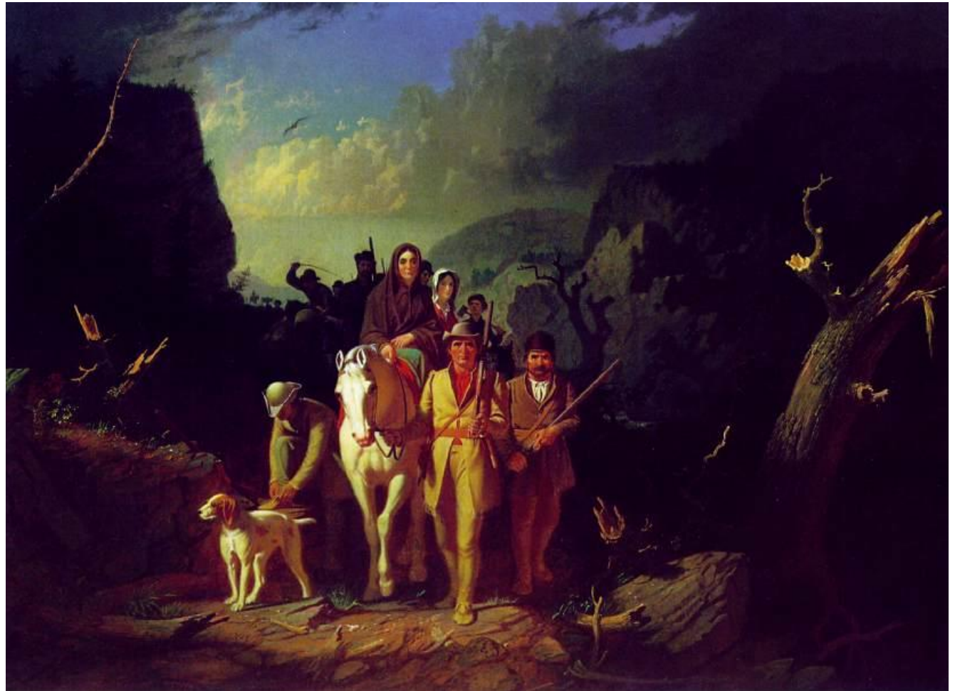
George Caleb Bingham Daniel Boone Escorting Settlers Through the Cumberland Gap 1851-52