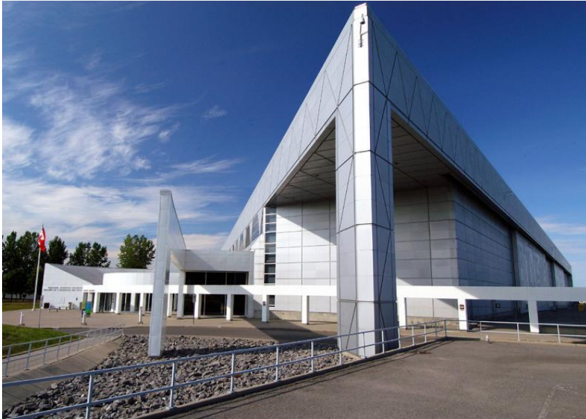
Музей авиации в Оттаве