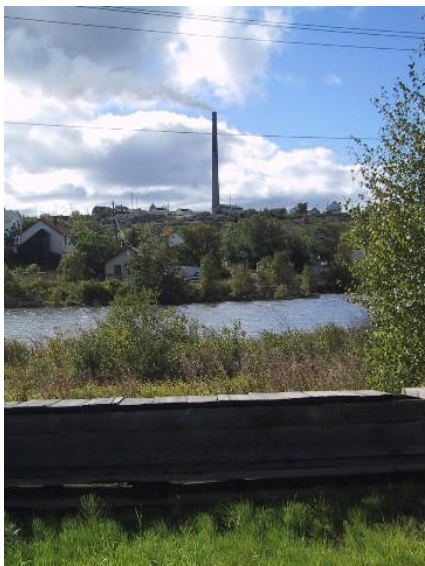
Город медных рудников Флин-Флон