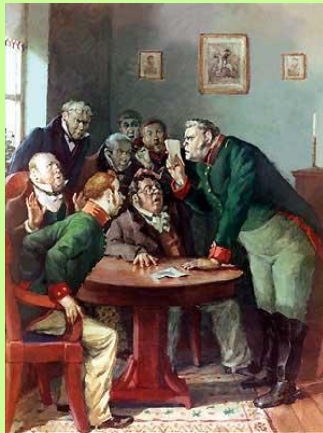
Действие I, явление 5-е.