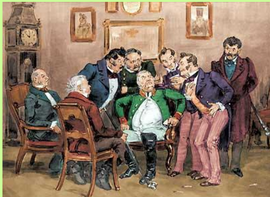
Чиновники обсуждают письмо Хлестакова