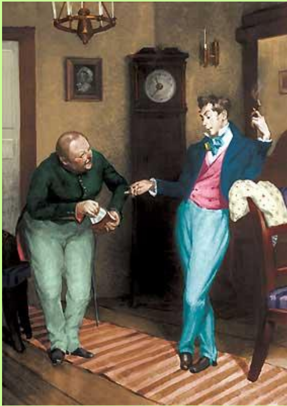
Хлестаков и Земляника