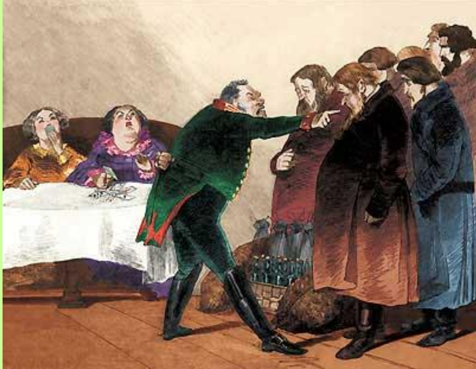
Торжество Городничего. Разговор с купцами