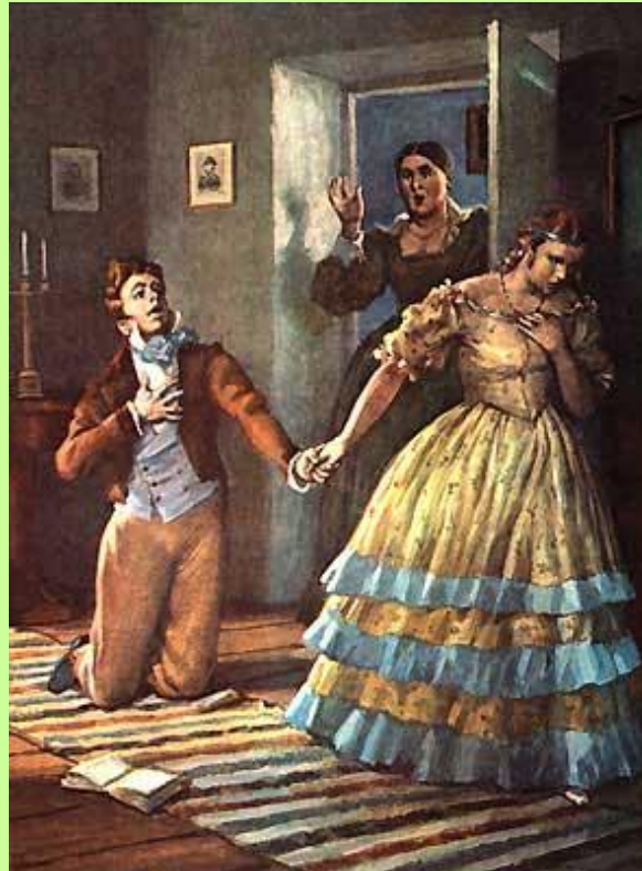
Объяснение в любви