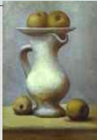
Кувшин с яблоками. Пикассо