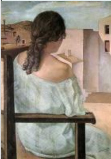
Девушка сидящая спиной. С.Дали