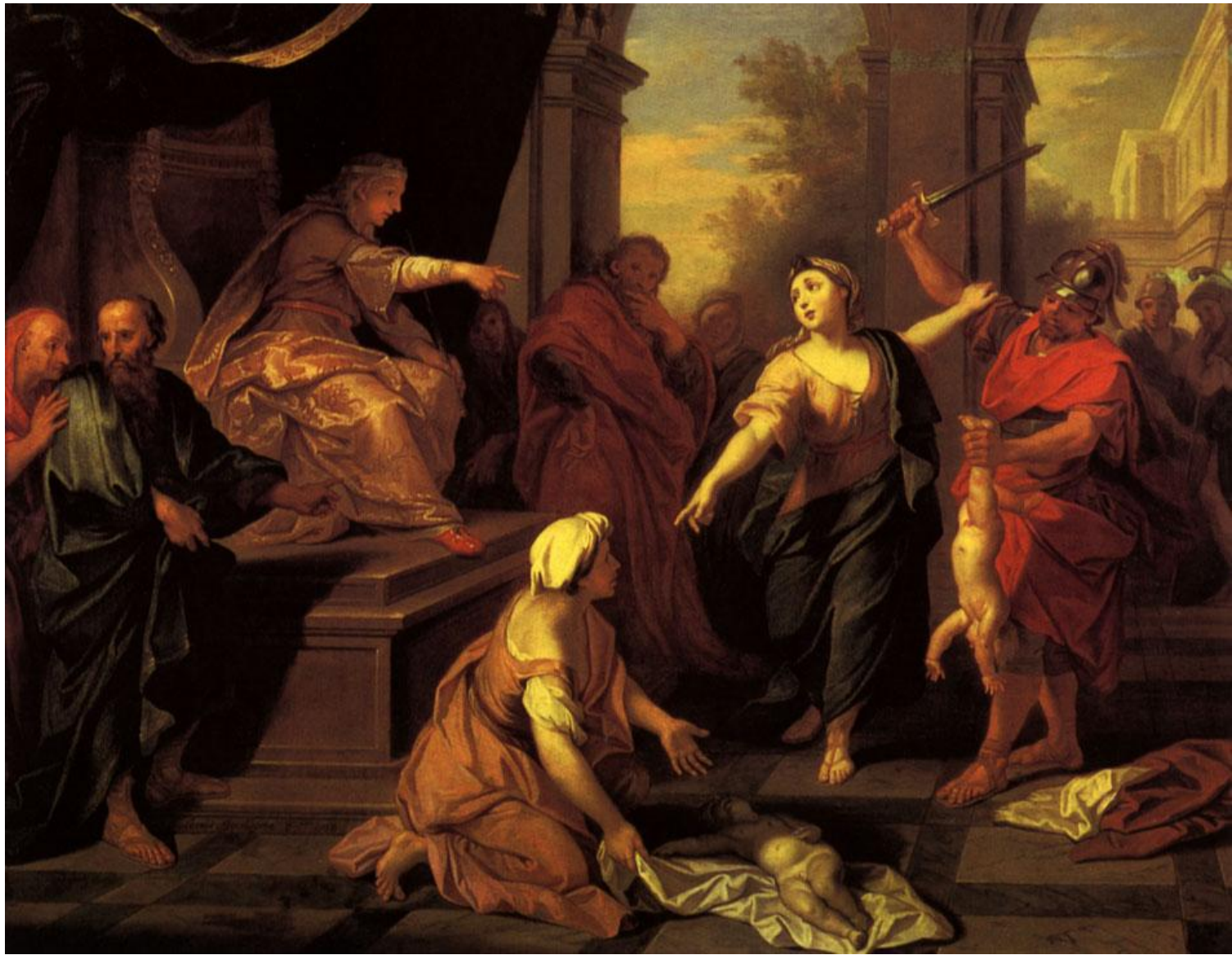
Франция, XVII – XVIII вв.