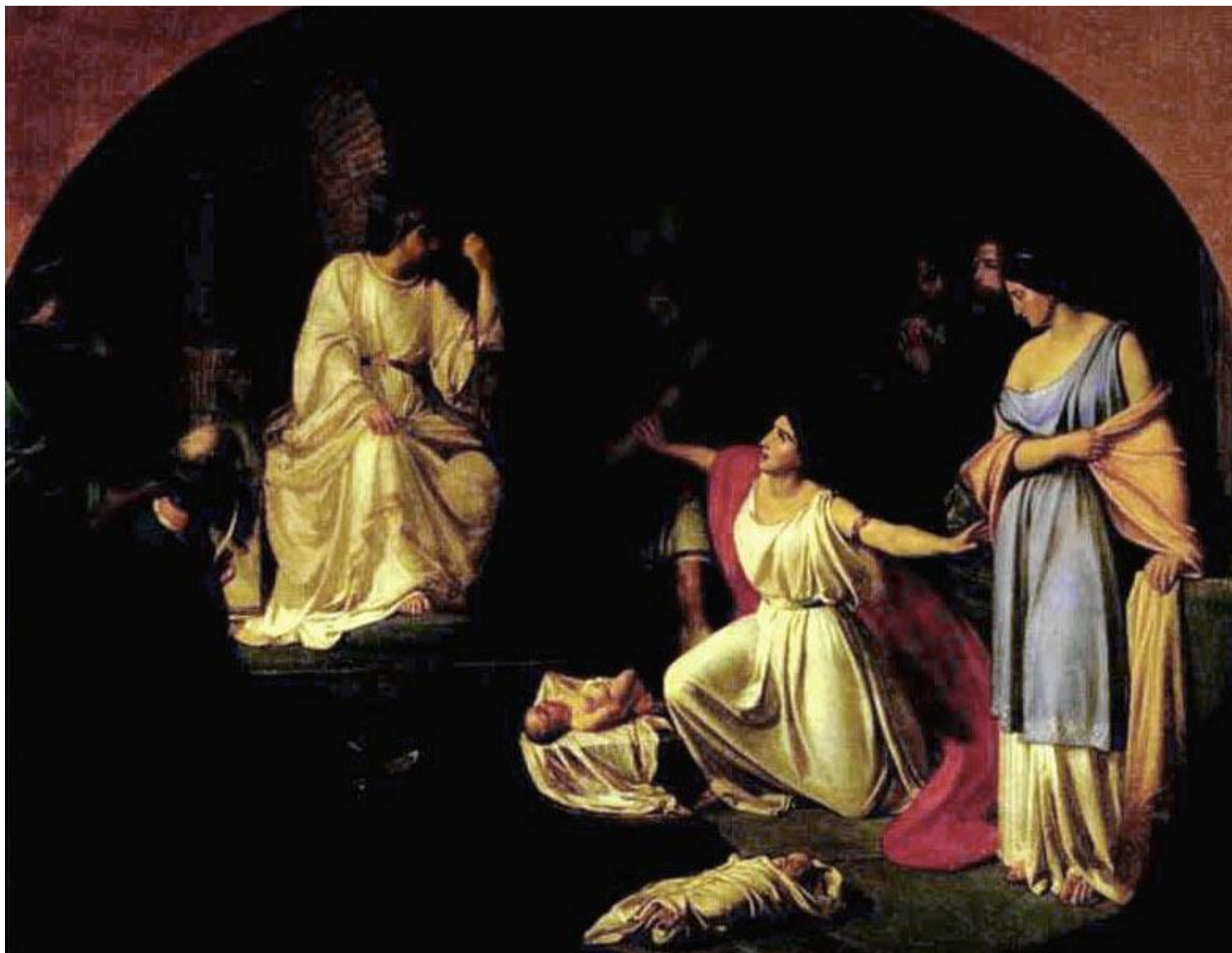
Николай Николаевич Ге "Суд царя Соломона" 1854 г.