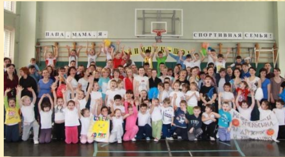
МАМА, ПАПА, Я - СПОРТИВНАЯ СЕМЬЯ!