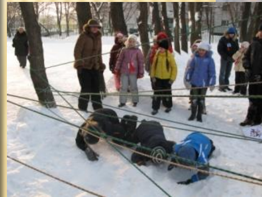
МАЛЫЕ ОЛИМПИЙСКИЕ ИГРЫ