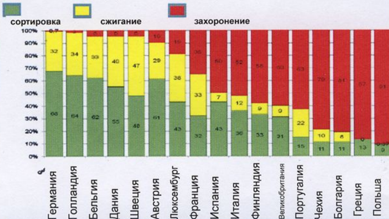
Переработка ТКО в странах ЕС в 2006 году