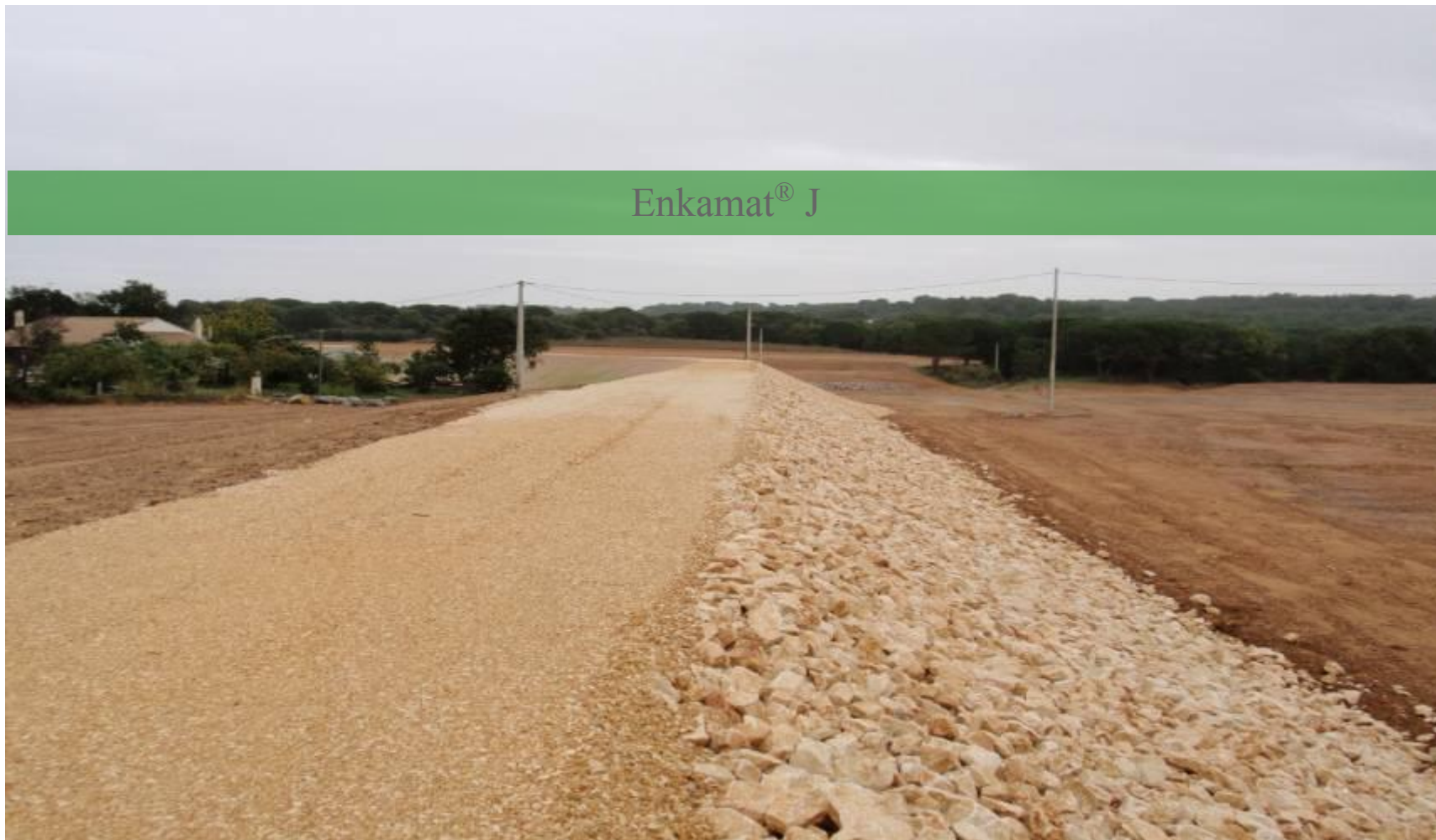
Фото – каменная наброска