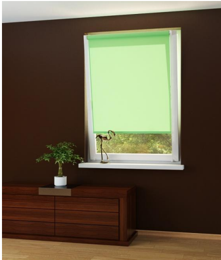
Коллекция рулонных штор Primo

5. Коллекция Primo - Широкая цветовая гамма по привлекательной цене