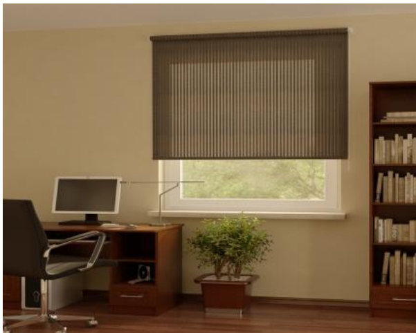
Коллекция рулонных штор Nature

3. Коллекция Sweet Dream – широкая цветовая гамма рулонных штор Blackout, со 100% светонепроницаемостью, гарантирует полное затемнение