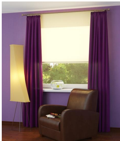
Система Cesario – крепление рулонной шторы на карниз

5. Коллекция Primo - Широкая цветовая гамма по привлекательной цене