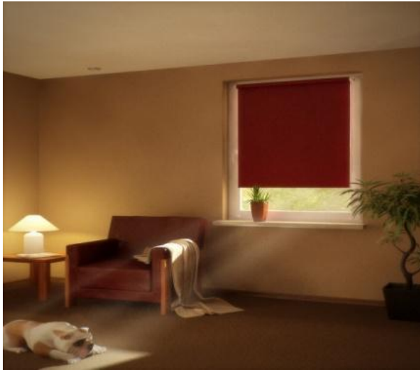
Коллекция рулонных штор Sweet Dreams

3. Коллекция Sweet Dream – широкая цветовая гамма рулонных штор Blackout, со 100% светонепроницаемостью, гарантирует полное затемнение